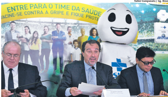
Ministro da Saúde, Gilberto Oechi (centro), lança a 20ª campanha contra a gripe

O grupo prioritário desta campanha são pessoas a partir de 60 anos, crianças de seis meses a menores de cinco anos, trabalhadores de saúde, professores das redes pública e privada, povos indígenas, gestantes, puérperas