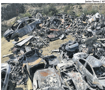
Fogo deixou um rastro de casas e carros queimados