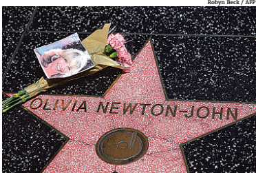
Fãs homenageiam a atriz na Calçada da Fama

Estados Unidos A cantora e atriz Olivia Newton-John, que atingiu o topo das paradas de música pop nas décadas de 1970 e 1980 com sucessos como I Honestly Love You e Physical e estrelou o filme musical Grease - Nos Tempos da Brilhantina , morreu ontem, aos 73 anos, em sua casa no sul da Califórnia.