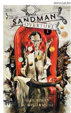
Arte conceitual é de Dave McKean

de publicar em 1996, pelo selo Vertigo, da DC Comics. Além das capas de McKean, a nova fase de Sandman terá desenhos de J.H. Williams III. McKean foi o capista da série Sandman e também colaborou com Gaiman em outros projetos, como a também clássica minissérie Orquídea Negra. Sandman é um dos sete irmãos autointitulados Os Perpétuos: Sonho, Morte, Destino, Destruição, Desejo, Desespero e Delírio, todos deuses que interferem intimamente no cotidiano dos seres humanos.