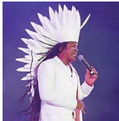
Domingo, cantor começa o Sarau