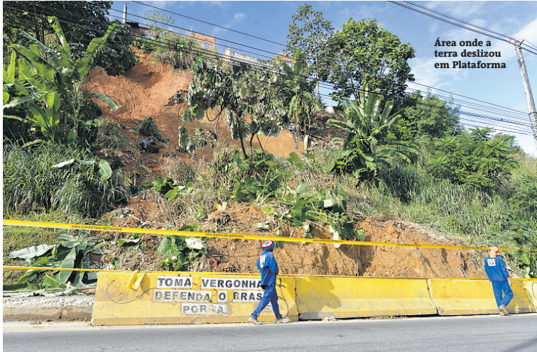
GABRIELA ALBACH A TARDE SP

GABRIEL ANDRADE* O deslizamento que aconteceu na manhã da última quarta-feira na avenida Afrânio Peixoto (Suburbana), no bairro de Plataforma, foi apenas um dos 738 registrados, até o momento, em 2018 na capital baiana.