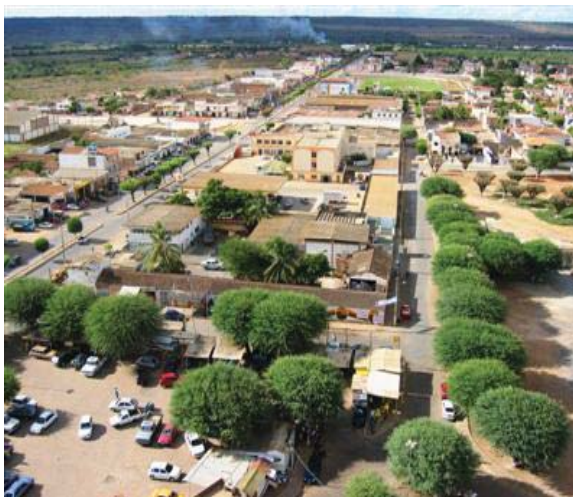
Imagens aéreas de Irecê.