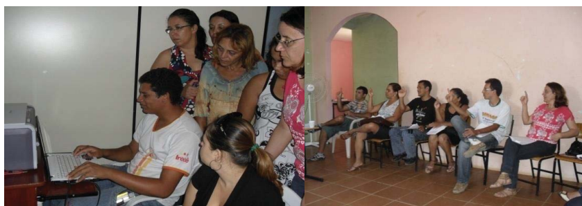
Fotos: Curso - A inclusão dos alunos com deficiência visual e auditiva na escola inclusiva. Local: ADEVIR/ Julho - Agosto de 2010 APAE/ Setembro - Outubro de 2010