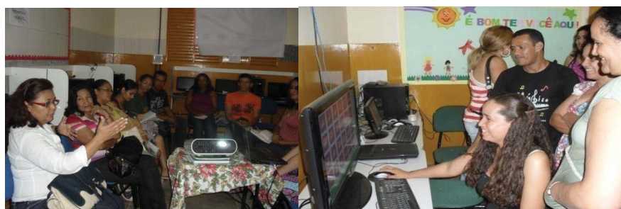
Fotos: Seminário de Avaliação e encaminhamento de Propostas para a Educação Especial na perspectiva inclusiva.