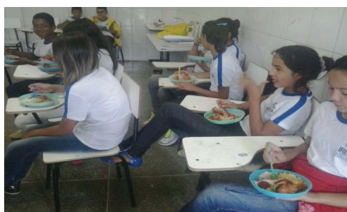
Fotos :I e II Parada da Educação Especial 2014 e 2015.