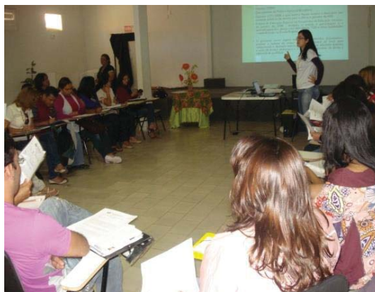
Fotos: Seminário de Avaliação e encaminhamento de Propostas para a Educação Especial na perspectiva inclusiva.