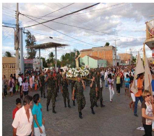
Igreja de São Domingos localizada ao lado da prefeitura. Foto: Procissão de São Domingos.