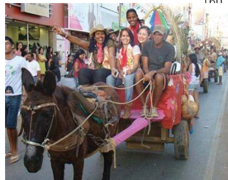
Desfile de Carroças pelas ruas da cidade.