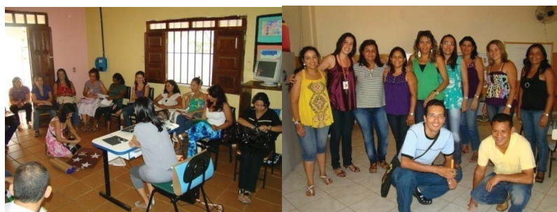
Fotos: II Encontro de Educadores da Rede Municipal de Ensino – Outubro de 2009.