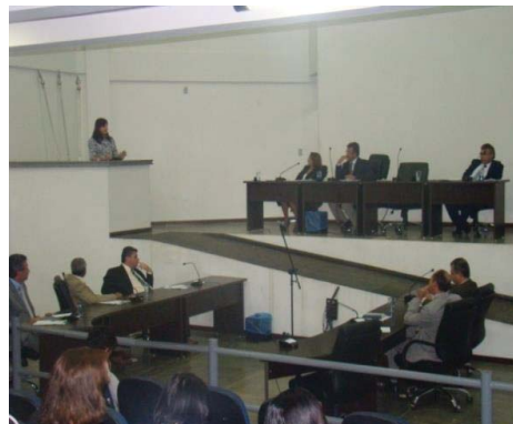
Fotos da Câmara Municipal - Audiência que Instituiu o Dia Municipal da Leitura em Irecê. Arquivo da Secretaria de Educação.