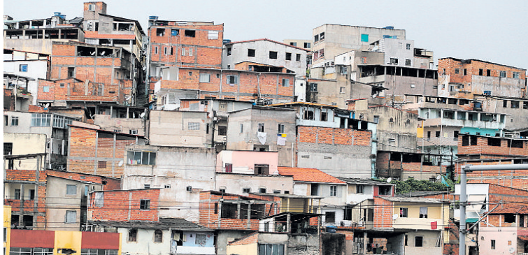
Trabalhador que ganha um salário mínimo e mora nas comunidades teve expectativa de aumento reduzida

A estimativa para o salário mínimo em 2019, proposta em abril, foi reduzida de R$ 1.002 para R$ 998. A informação consta de nota técnica da Comissão Mista de Orçamento do Congresso Nacional que analisa o Projeto de Lei de Diretrizes Orçamentárias para 2019. Por lei, o reajuste do salário mínimo é feito com base na variação do Índice Nacional de Preços ao Consumidor (IPCA), acumulada em 12 meses, acrescida da variação real do Produto Interno Bruto (PIB), soma de todos os bens e serviços produzidos no País de dois anos anteriores. Assim, o salário mínimo de 2019 deve ser corrigido pelo INPC de 2018 e terá aumento real equivalente à taxa de crescimento do PIB em 2017.