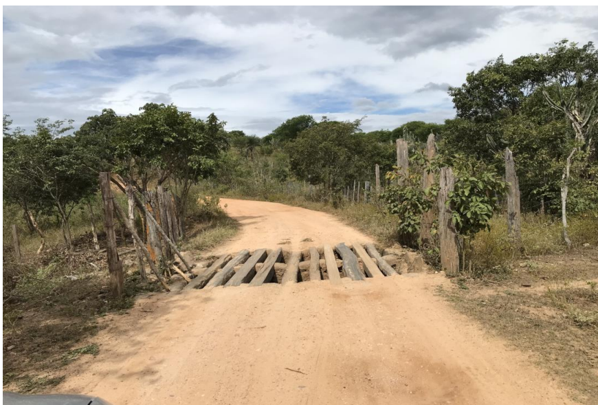
Figura 36: Trecho 02 – Mata burro a ser substituído - (Coord. 306664/8596542)