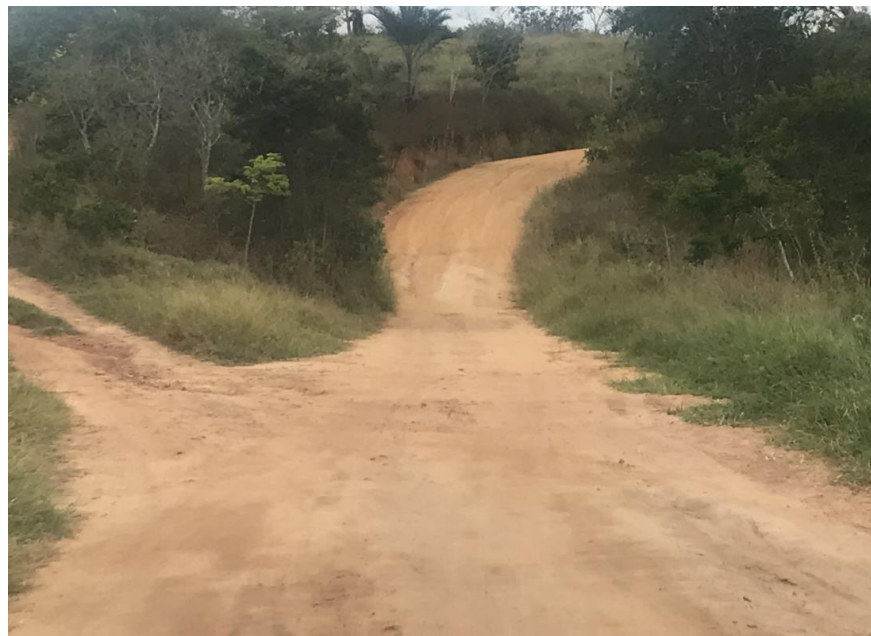
Figura 29: Trecho 02 – (Coord. 303375/ 8590464).