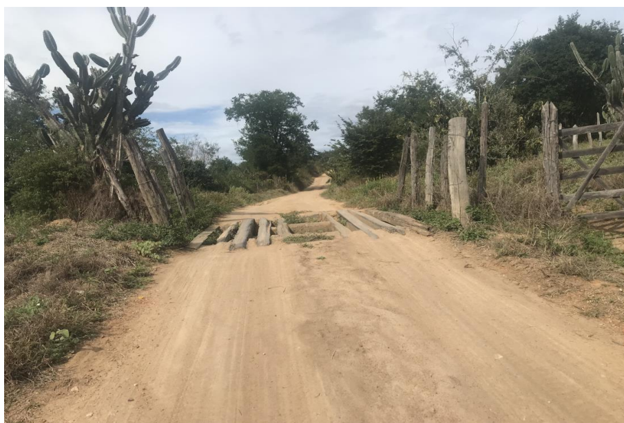
Figura 58: Trecho 03 - Mata burro a ser substituído - (Coord. 318379/ 8599234)