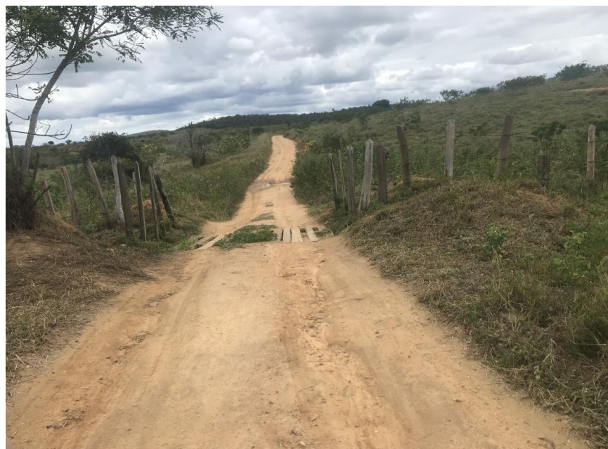
Figura 22: Trecho 01 – Mata burro a ser substituído - (Coord. 299807/ 8587934)