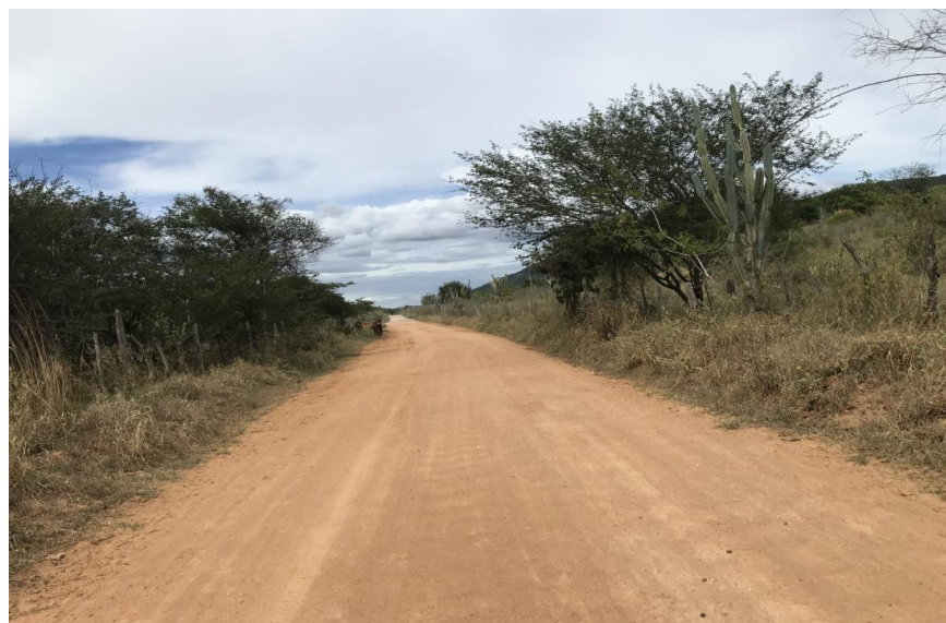
Figura 50: Trecho 03 - Ponto do trecho a ser recuperado (Coord. 311784/ 8598378).