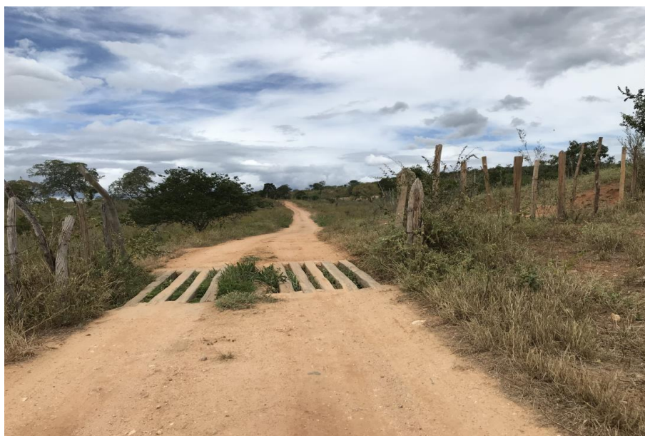
Figura 38: Trecho 02 – Mata burro a ser substituído - (Coord. 307203/ 8597034)