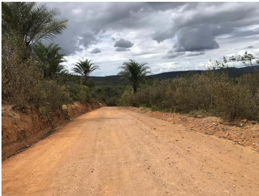
Figura 35: Trecho 02 – (Coord. 305960/ 8595920)