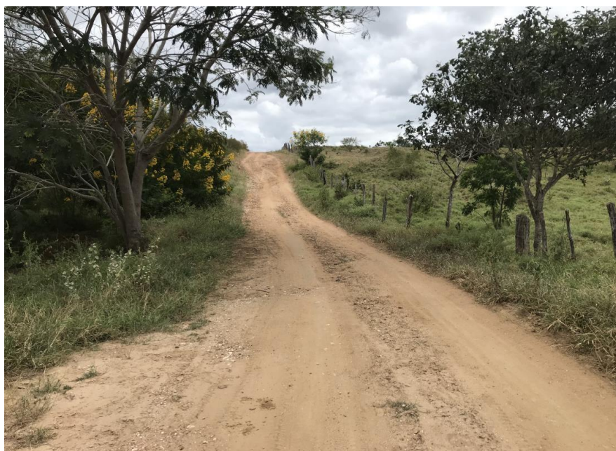
Figura 06: Trecho 01 – Ponto de implantação do BTTC 100 (Coord. 293305/ 8583026).