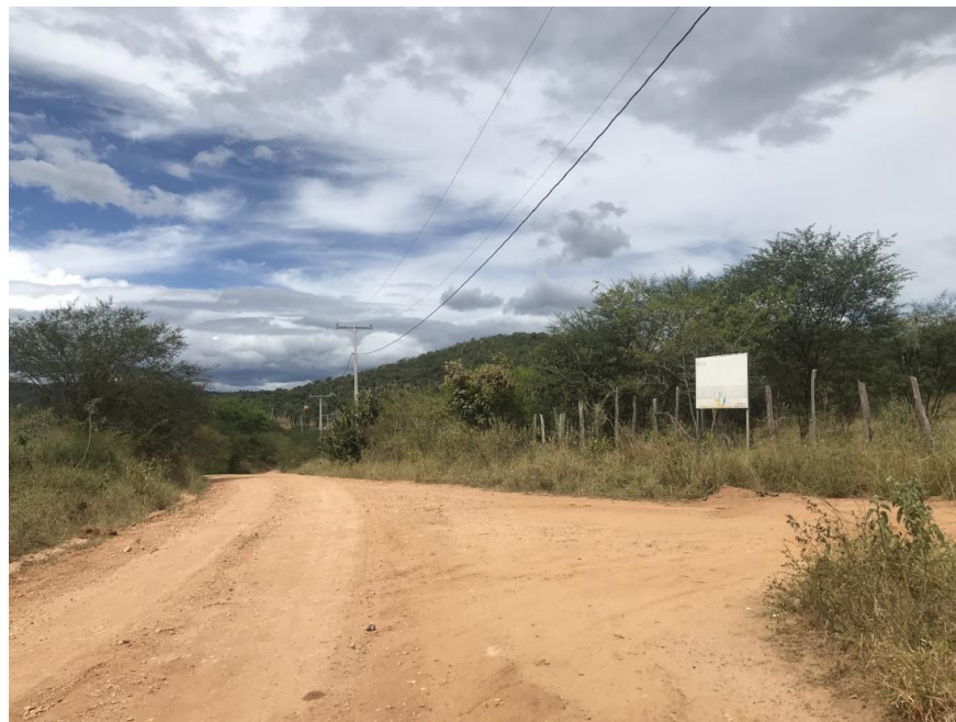
Figura 43: Trecho 02 – Entrada do Assentamento São Félix (Coord. 308460/ 8597614).