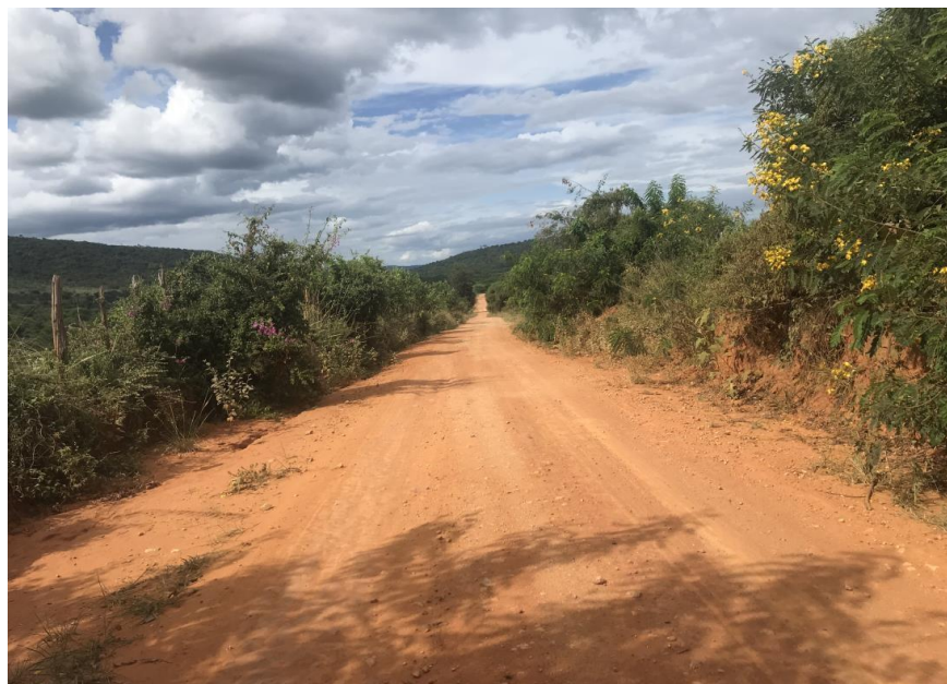
Figura 54: Trecho 03 - Ponto do trecho a ser recuperado (Coord. 315985/ 8599664)