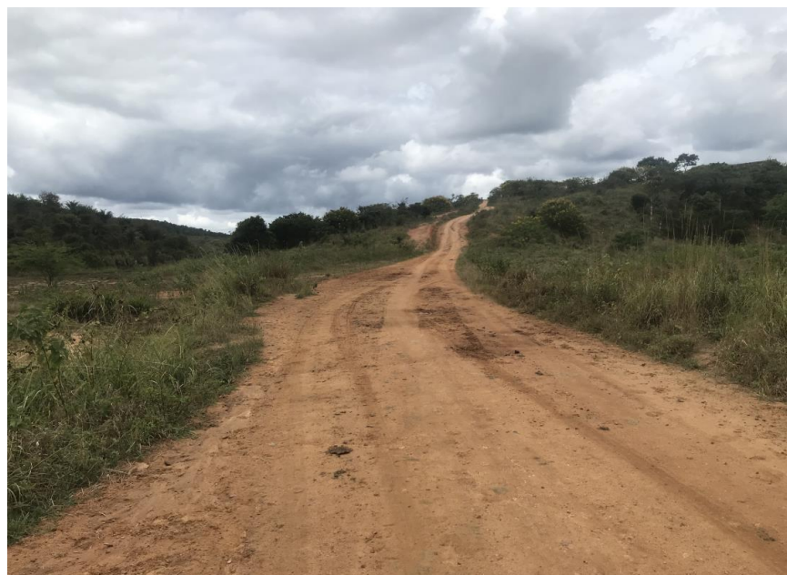
Figura 20: Trecho 01 – Ponto de implantação do BSTC 80 (Coord. 299388/ 8587946)