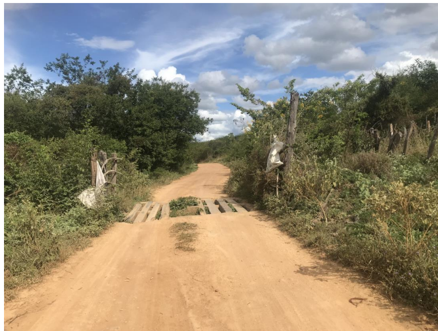
Figura 55: Trecho 03 - Mata burro a ser substituído - (Coord. 316705/ 8599888)