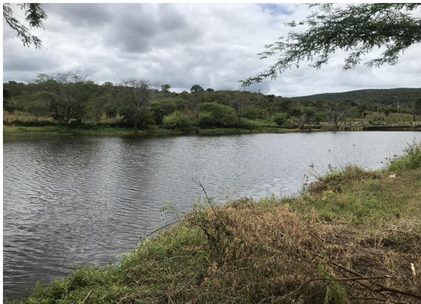
Figura 63: Barragem para captação de água - (Coord. 293645/ 8580312)