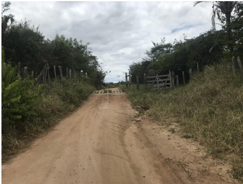
Figura 09: Trecho 01 – Mata burro a ser substituído - (Coord. 293589/8585288)