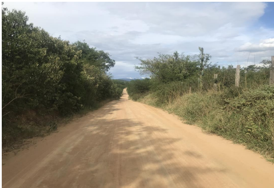
Figura 59: Trecho 03 - Ponto do trecho a ser recuperado (Coord. 319953/ 8599652)