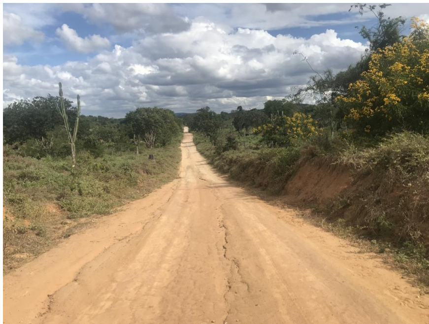
Figura 57: Trecho 03 - Ponto do trecho a ser recuperado (Coord. 318115/ 8599412)