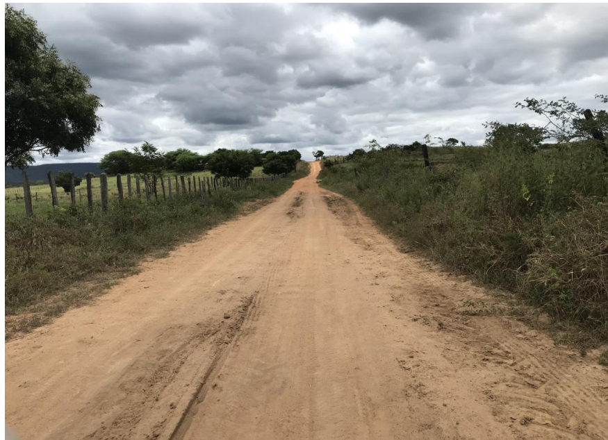
Figura 05: Trecho 01 – (Coord. 293612/ 8582240).