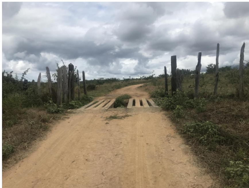
Figura 23: Trecho 01 – Mata burro a ser substituído - (Coord. 300184/ 8587846)