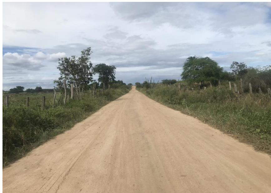
Figura 61: Trecho 03 - Ponto de implantação do BSTC 60 (Coord. 320944/8600094)