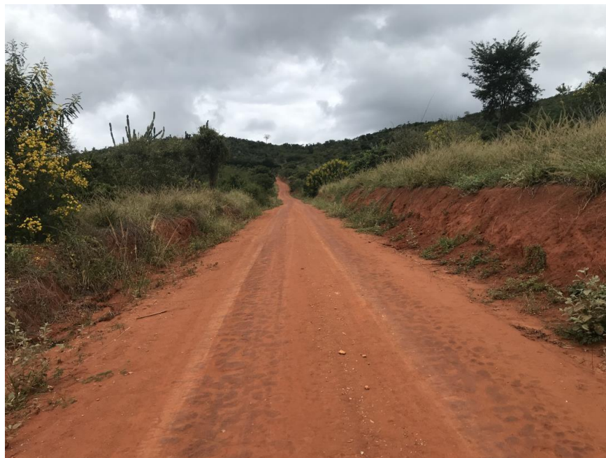
Figura 13: Trecho 01 – (Coord. 295758/ 8586342).