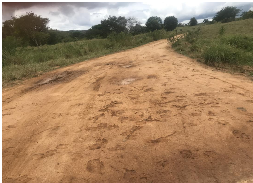
Figura 24: Trecho 01 – Ponto de implantação do BDTC 100 (Coord. 300582/ 8588082)