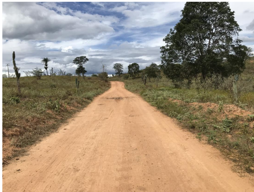
Figura 39: Trecho 02 – (Coord. 307461/ 8597116)