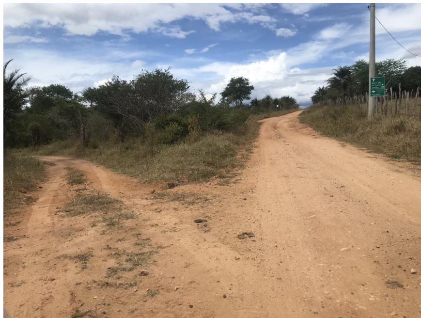
Figura 45: Início do trecho 03 – (Coord. 308748/ 8597814)