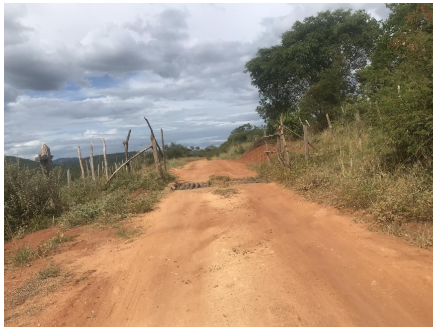
Figura 53: Trecho 03 - Mata burro a ser substituído - (Coord. 315059/ 8599232)