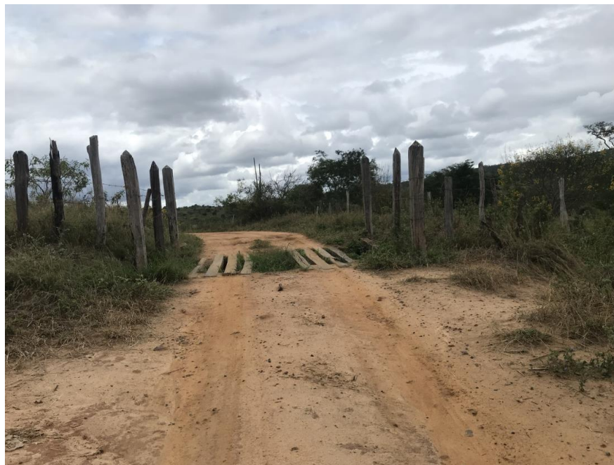
Figura 17: Trecho 01 – Mata burro a ser substituído - (Coord. 298613/ 8587350)