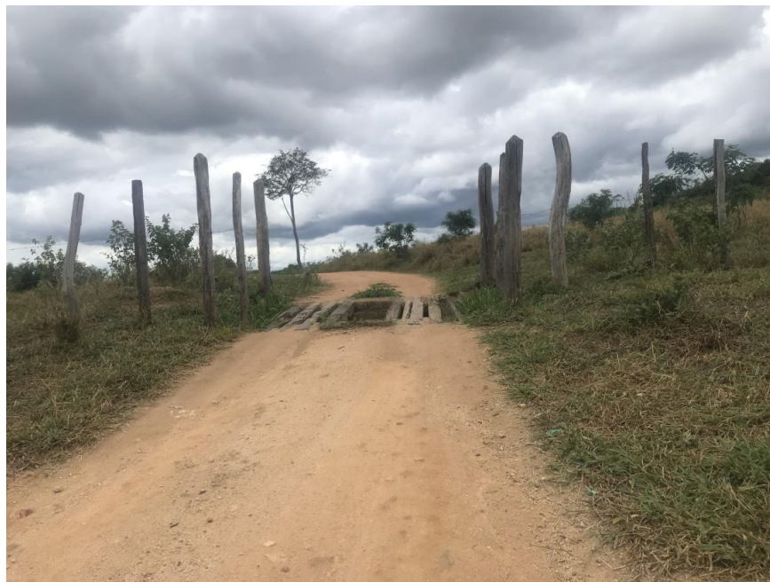
Figura 25: Trecho 01 – Mata burro a ser substituído - (Coord. 301056/ 8587680)