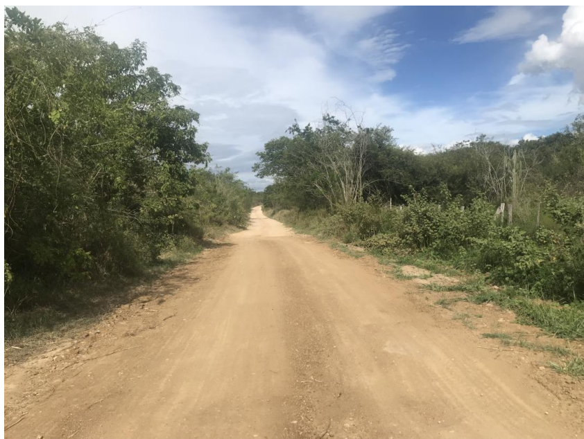
Figura 56: Trecho 03 - Ponto de implantação do BSTC 60 (Coord. 317285/ 8599712)