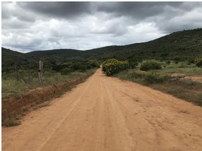
Figura 11: Trecho 01 – Mata burro a ser implantado - (Coord. 294269/ 8585924)