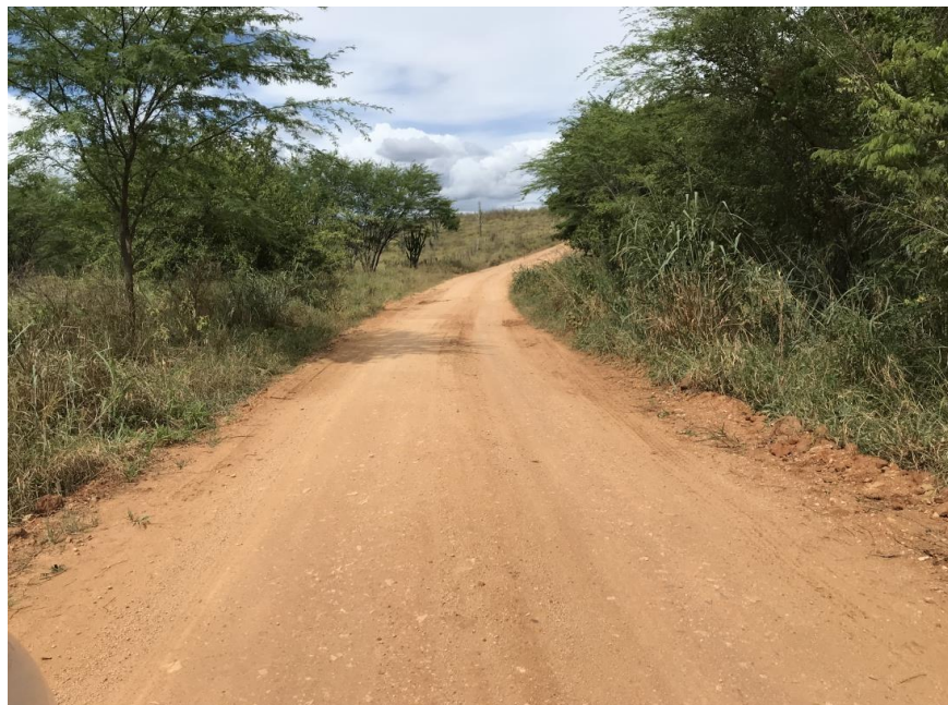
Figura 49: Trecho 03 - Ponto de implantação do BSTC 60 (Coord. 311266/ 8598530)