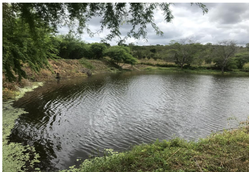
Figura 64: Barragem para captação de água - (Coord. 293645/ 8580312)