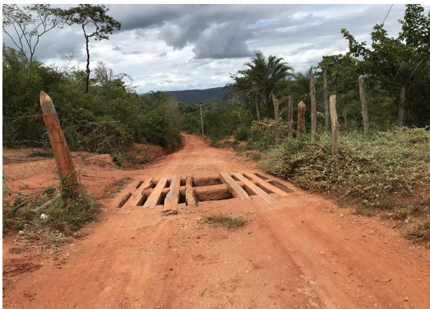
Figura 34: Trecho 02 – Mata burro a ser substituído - (Coord. 305266/ 8594576)