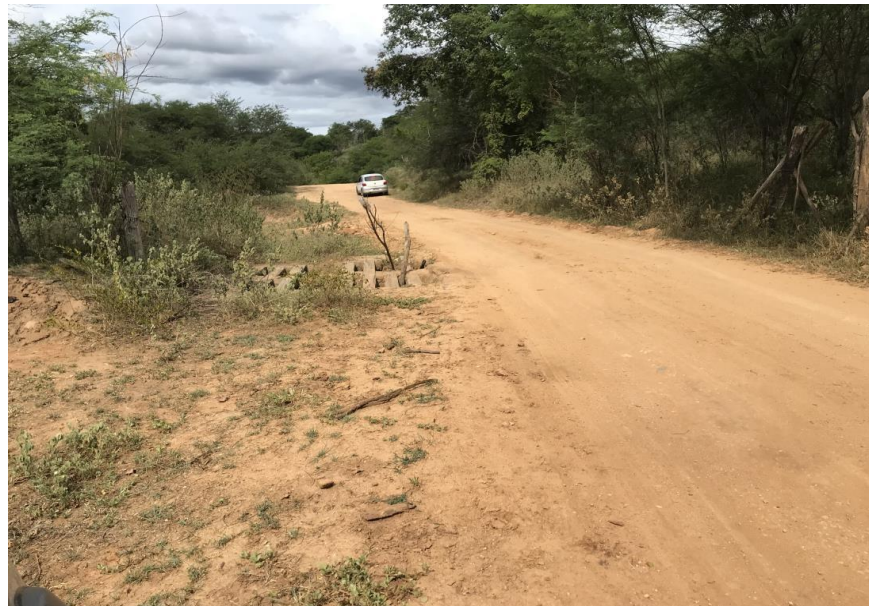
Figura 52: Trecho 03 - Mata burro a ser substituído - (Coord. 313707/ 8598876)