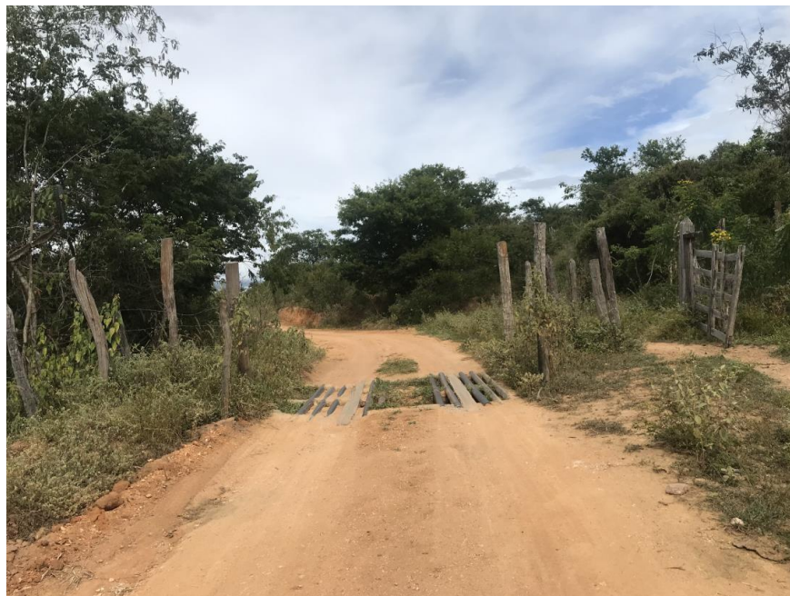
Figura: 47 Trecho 03 - Mata burro a ser substituído - (Coord. 310250/ 8598558)