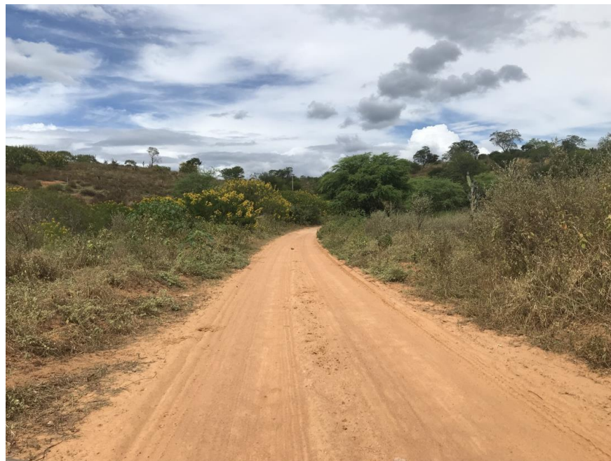
Figura 41: Trecho 02 – (Coord. 307881/ 8597356)