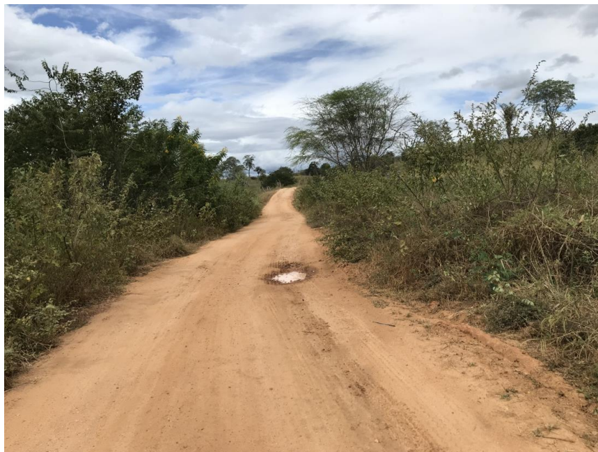
Figura 37: Trecho 02 – Ponto de implantação do BSTC 60 (Coord.307121/ 8597004)