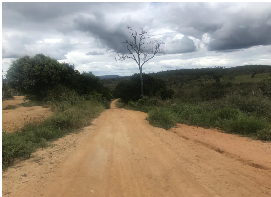
Figura 28: Início do trecho 02 – (Coord. 303122/ 8590042).