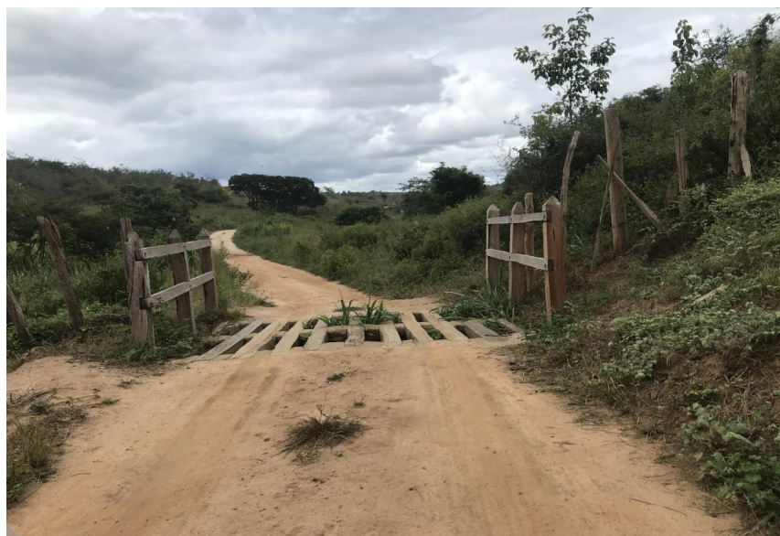
Figura 16: Trecho 01 – Mata burro a ser substituído - (Coord. 298375/ 8587350)