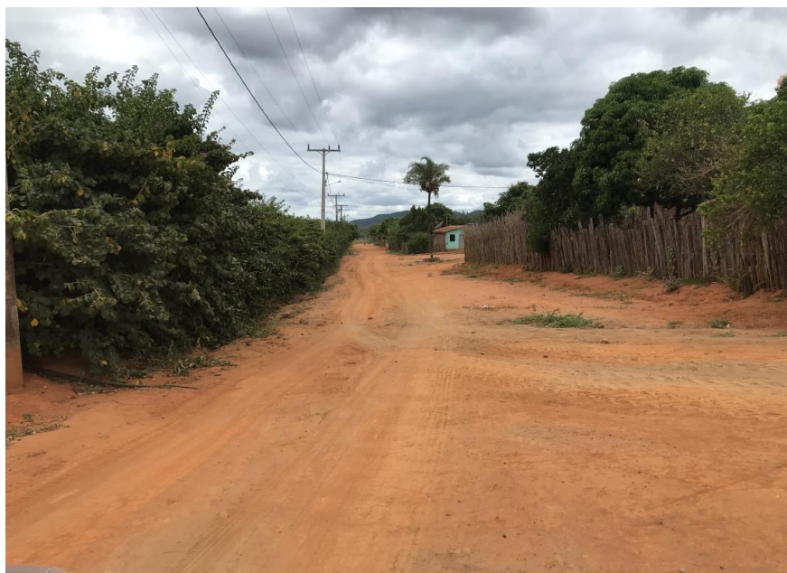
Figura 04: Trecho 01 – Assentamento Santa Fé (Coord. 293651/ 8581546).