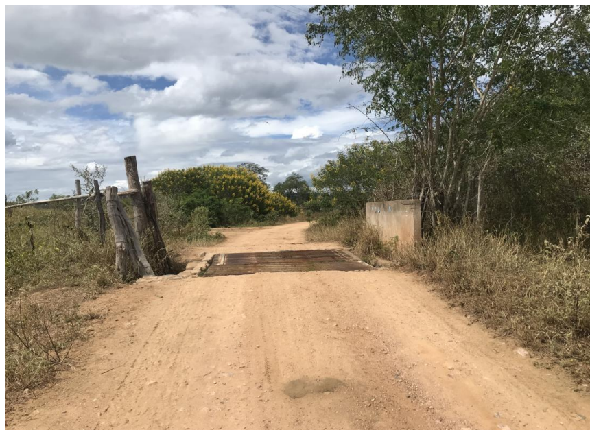
Figura 40: Trecho 02 – Mata burro a ser substituído - (Coord. 307594/ 8597214)