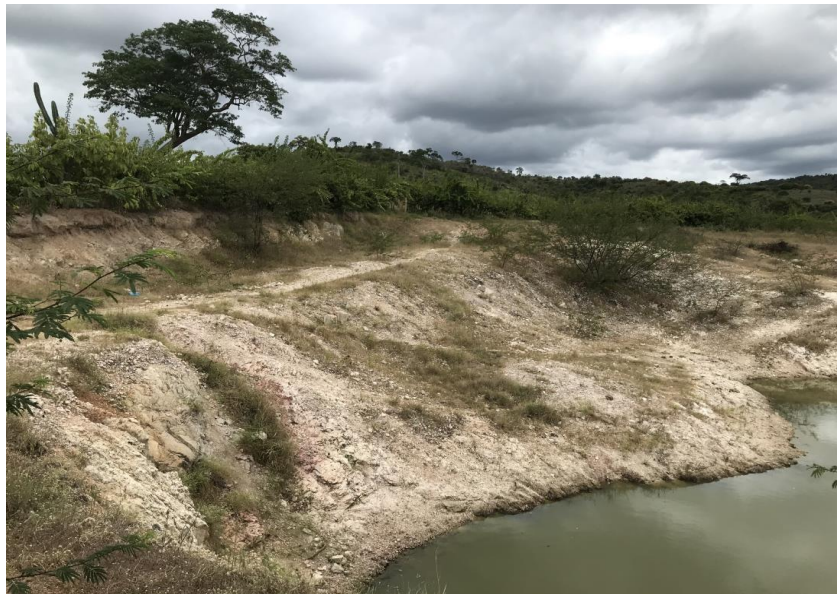
Figura 65: Jazida - (Coord. 293602/ 8579890)