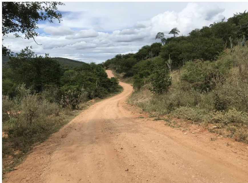
Figura 51: Trecho 03 - Ponto do trecho a ser recuperado (Coord. 312994/ 8598620)