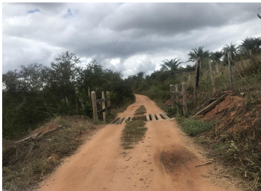
Figura 26: Trecho 01 – Mata burro a ser substituído - (Coord. 301531/ 8587734)