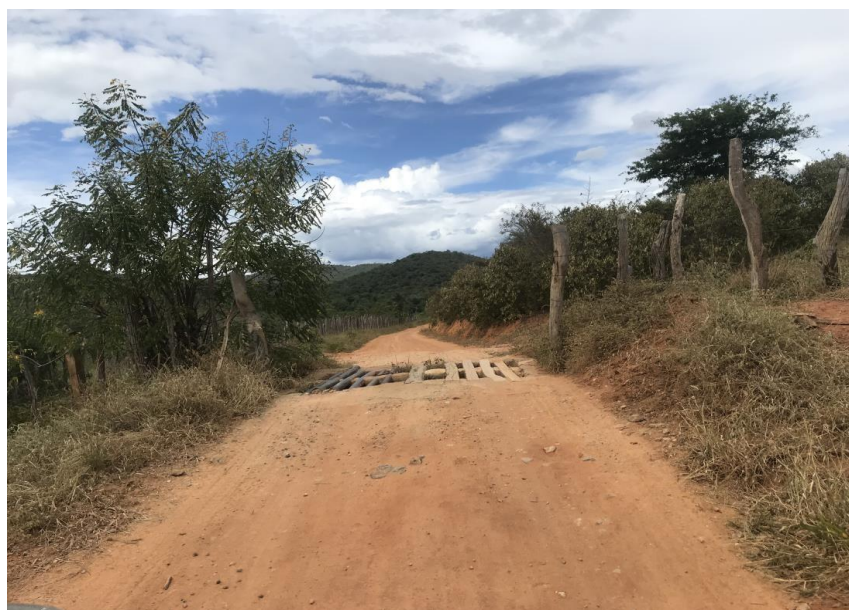
Figura 46: Trecho 03 - Mata burro a ser substituído - (Coord. 309090/ 8598148)