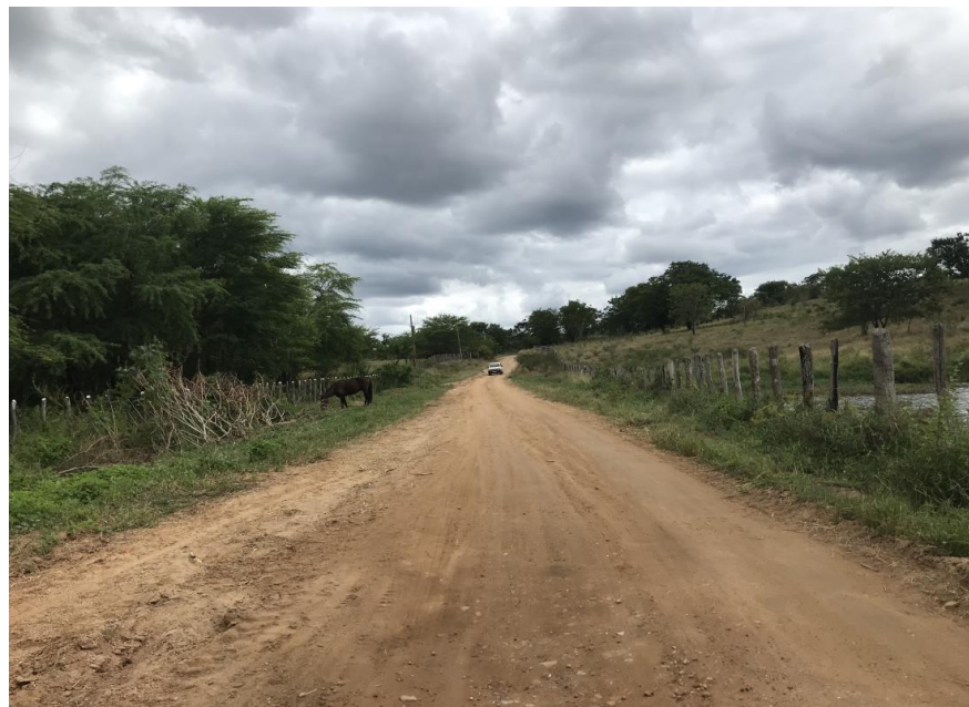
Figura 02: Trecho 01 – Ponto de implantação BTTC 100 (Coord. 293178/ 8580510)