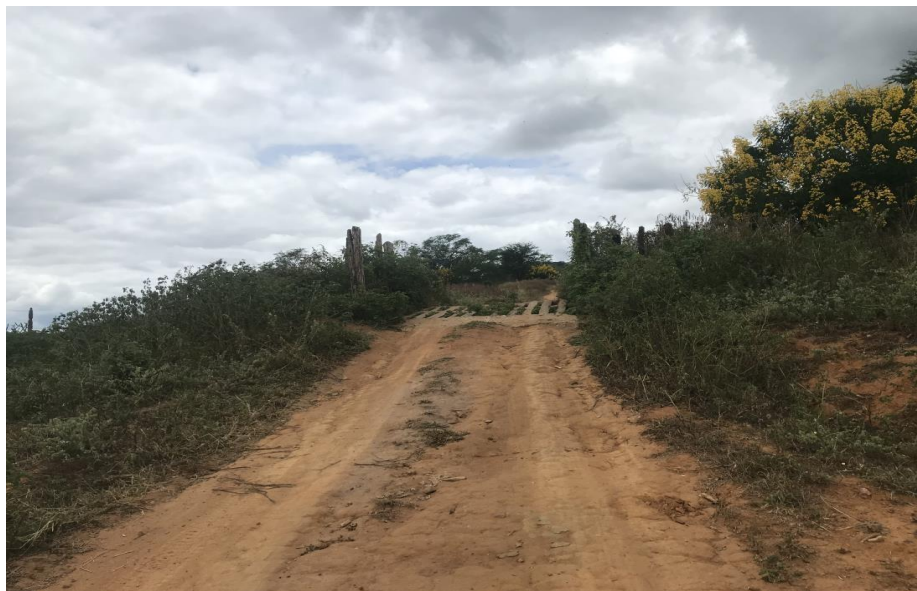
Figura 10: Trecho 01 – Mata burro a ser substituído - (Coord. 294098/8585796)