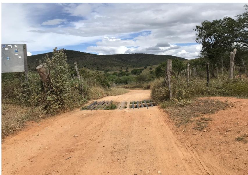
Figura 48: Trecho 03 - Mata burro a ser substituído - (Coord. 311063/ 8598562)