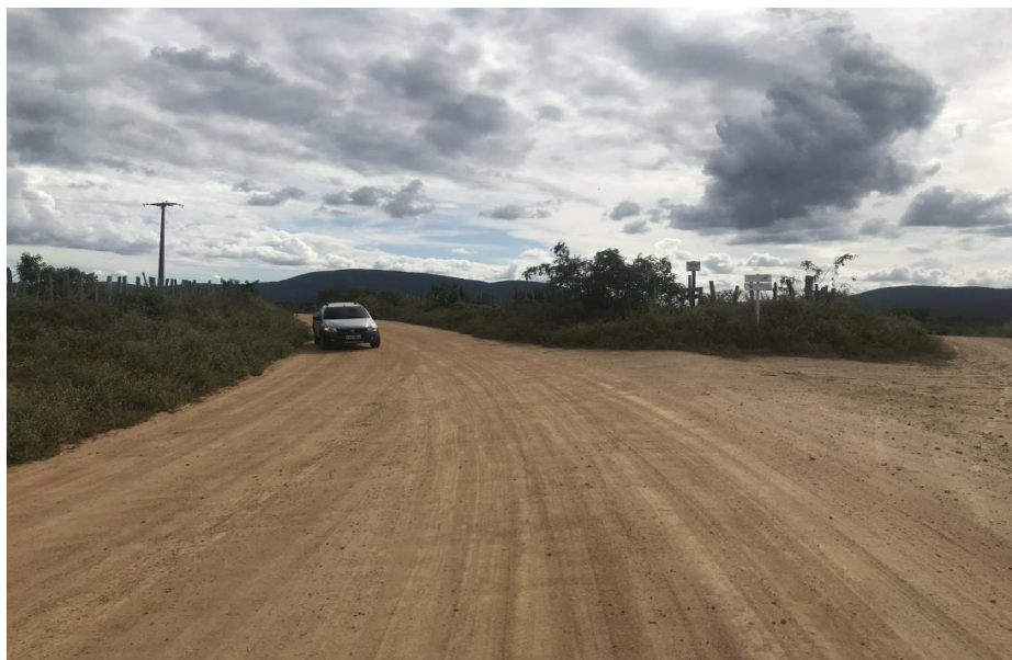
Figura 62: Fim do Trecho 03 (Coord. 321729/ 8600498)