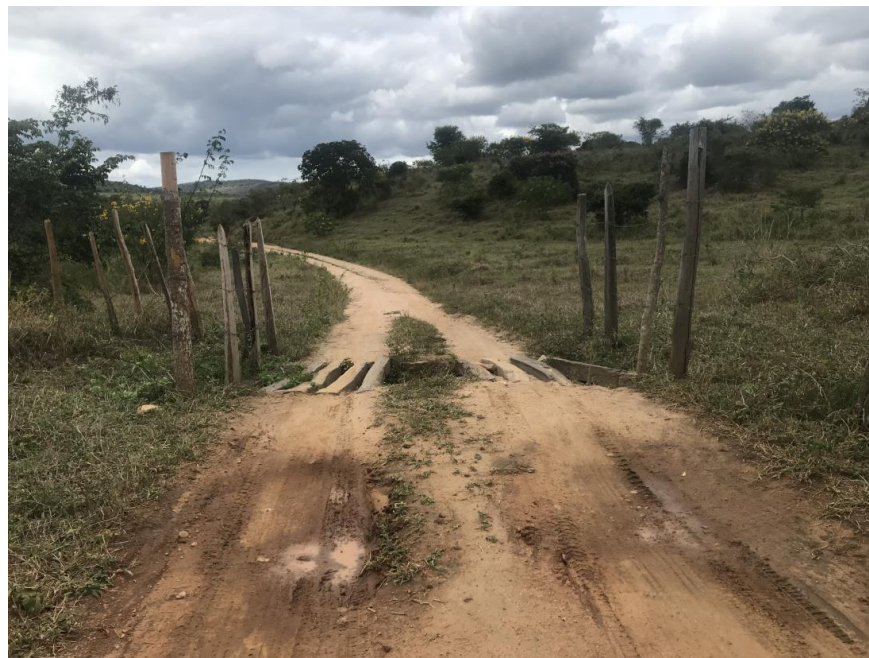
Figura 19: Trecho 01 – Mata burro a ser substituído - (Coord. 299148/ 8587856)