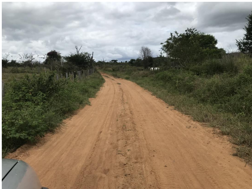
Figura 07: Trecho 01 – Ponto de implantação do BSTC 80 (Coord. 293613/8583954)