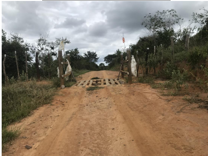
Figura 14: Trecho 01 – Mata burro a ser substituído - (Coord. 296460/ 8586870)