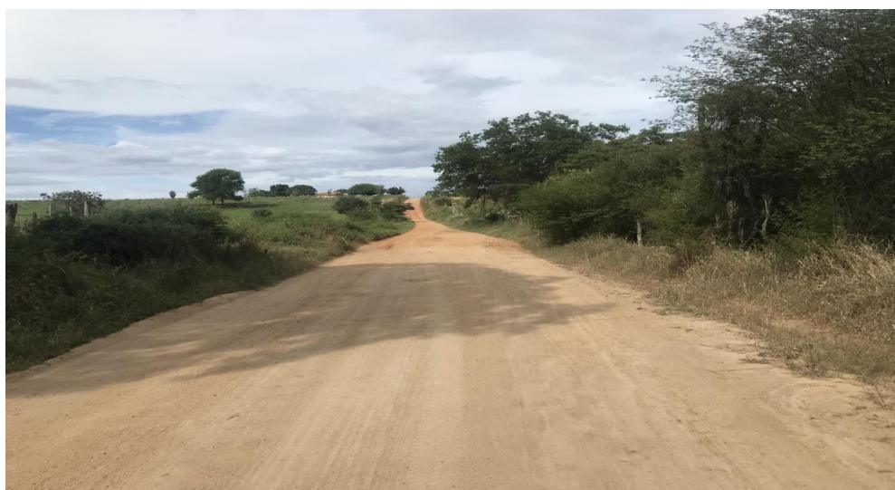
Figura 60: Trecho 03 - Ponto do trecho a ser recuperado com elevação de greide (Coord. 320436/ 8599836)