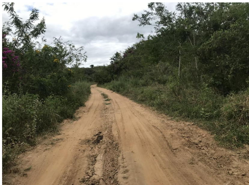
Figura 08: Trecho 01 – Ponto de implantação do BDTC 100 (Coord. 293547/8584930)