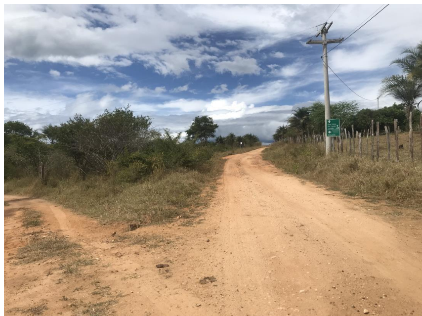
Figura 44: Fim do trecho 02 – (Coord. 308748/ 8597814)