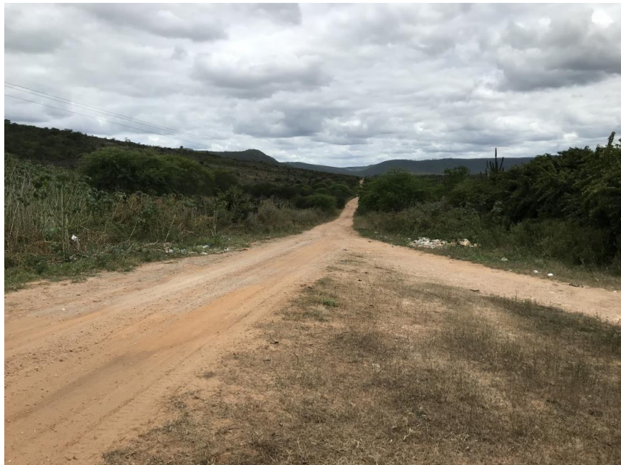
Figura 01: Início do trecho 01 – (Coord. 293182/ 8580142)