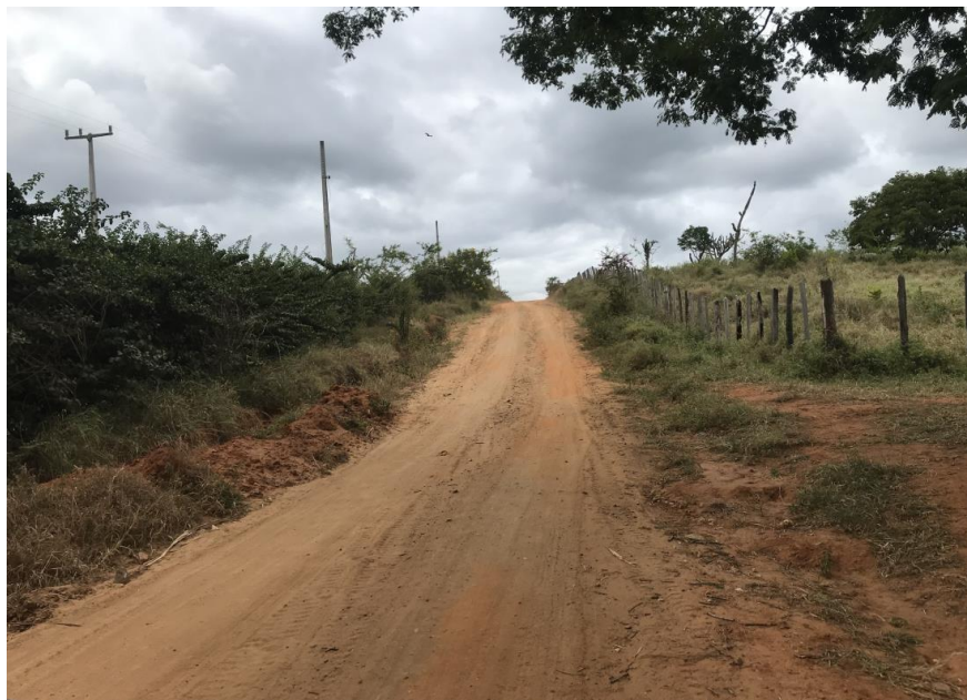
Figura 03: Trecho 01 – (Coord. 293430/ 8581222)