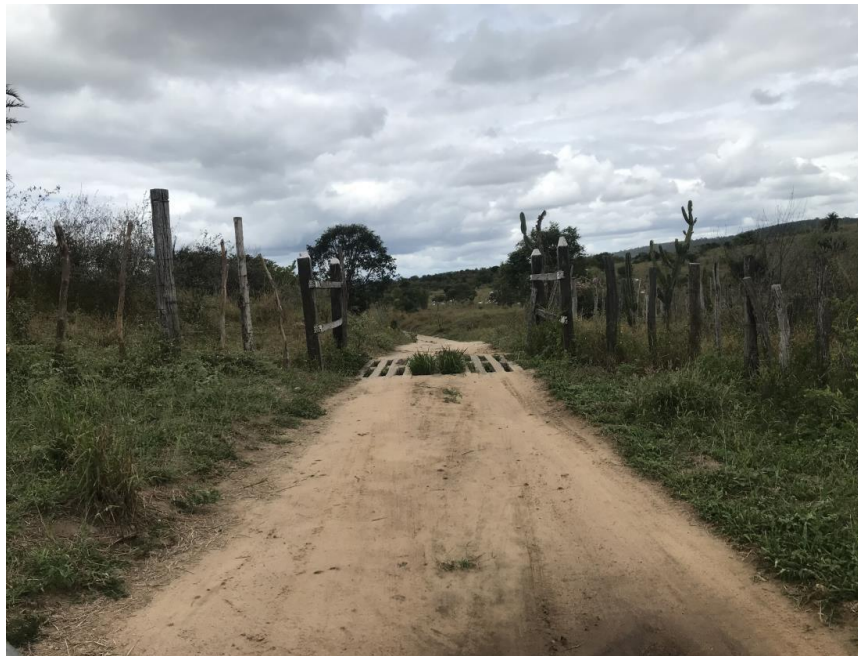
Figura 15: Trecho 01 – Mata burro a ser substituído - (Coord. 297418/8587172)