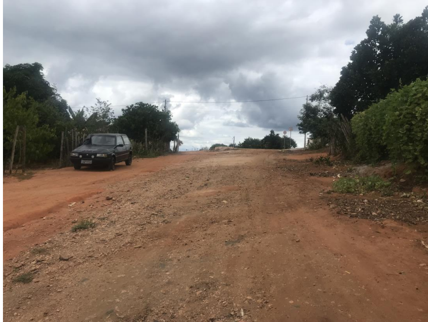
Figura 27: Fim do trecho 01 – (Coord. 302969/ 8589914)