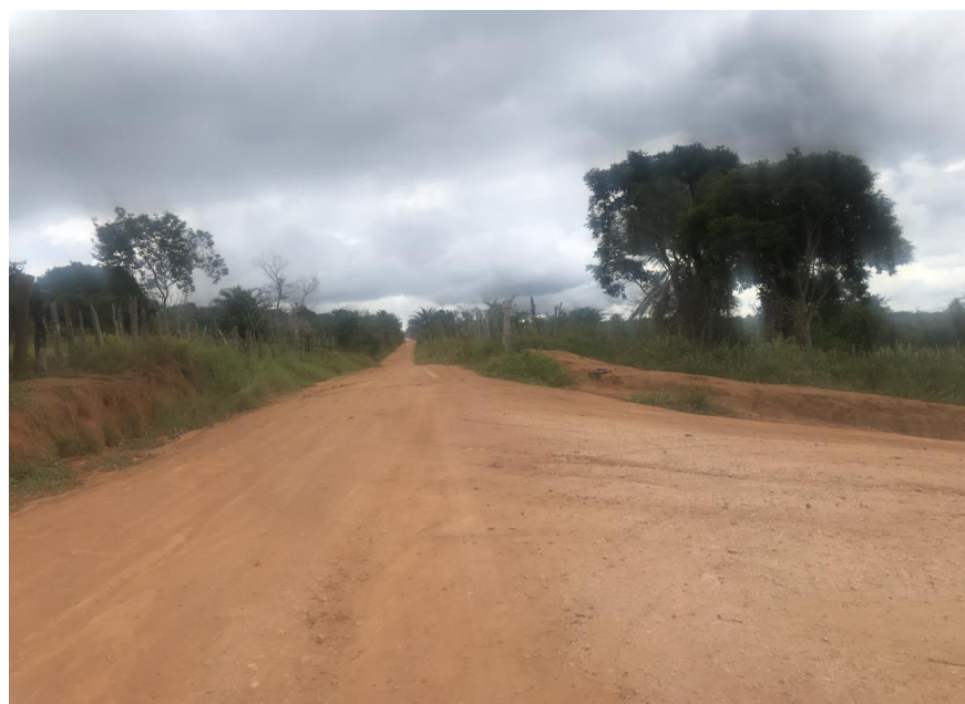
Figura 30: Trecho 02 – Entrada do Assentamento Cambuí (Coord. 304239/ 8591420).