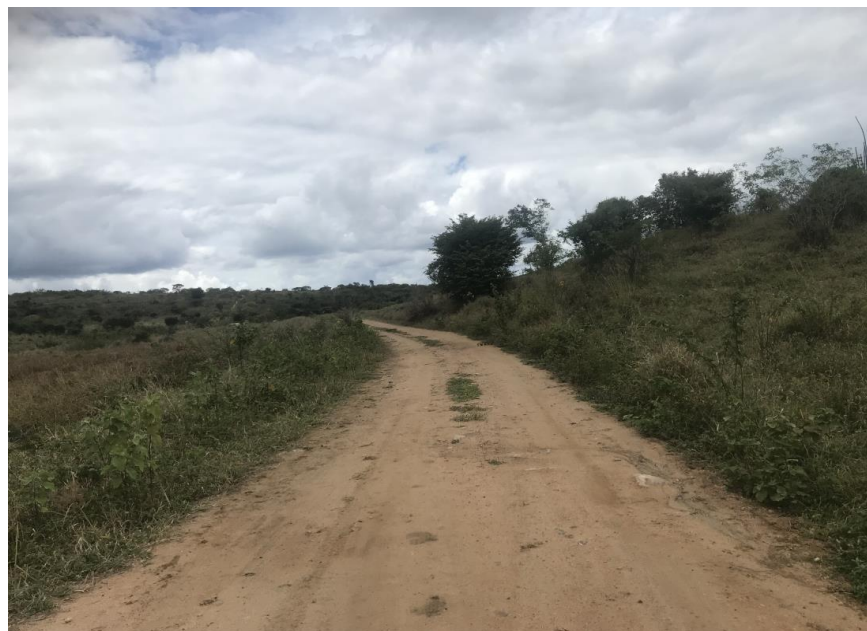
Figura 18: Trecho 01 – Trecho com greide a ser elevado (Coord. 298927/ 8587646)