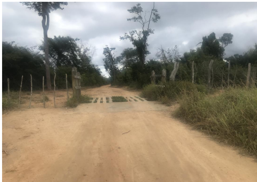
Figura 31: Trecho 02 – Mata burro a ser substituído - (Coord. 304682/ 8592372)