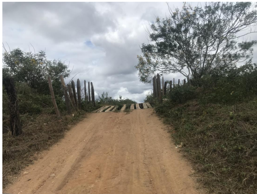
Figura 21: Trecho 01 – Mata burro a ser substituído - (Coord. 299647/ 8587958)