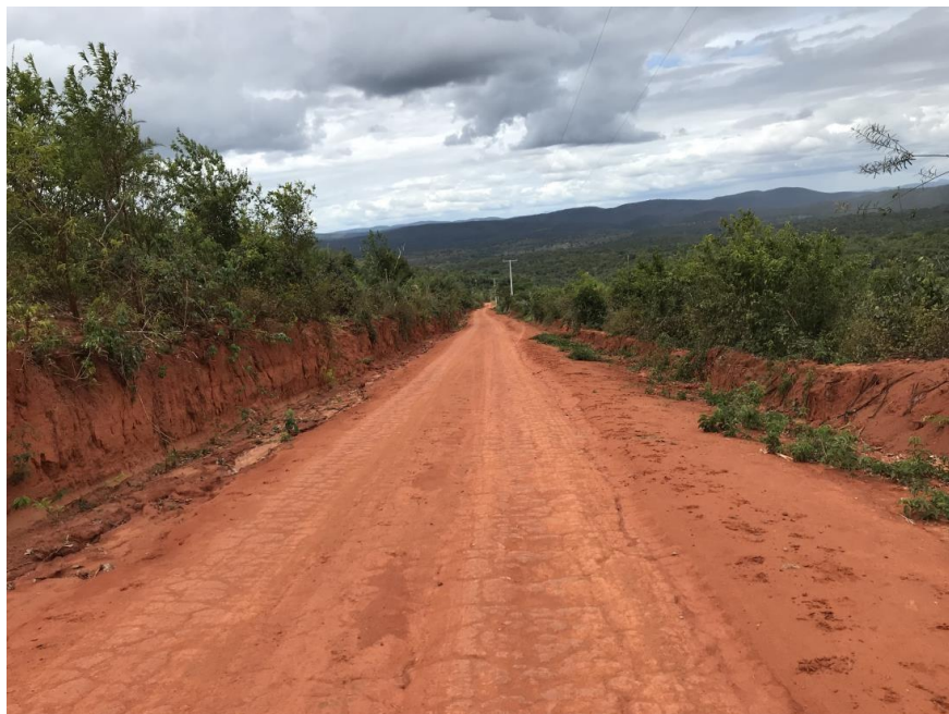
Figura 33: Trecho 02 – (Coord. 305070/ 8594284)