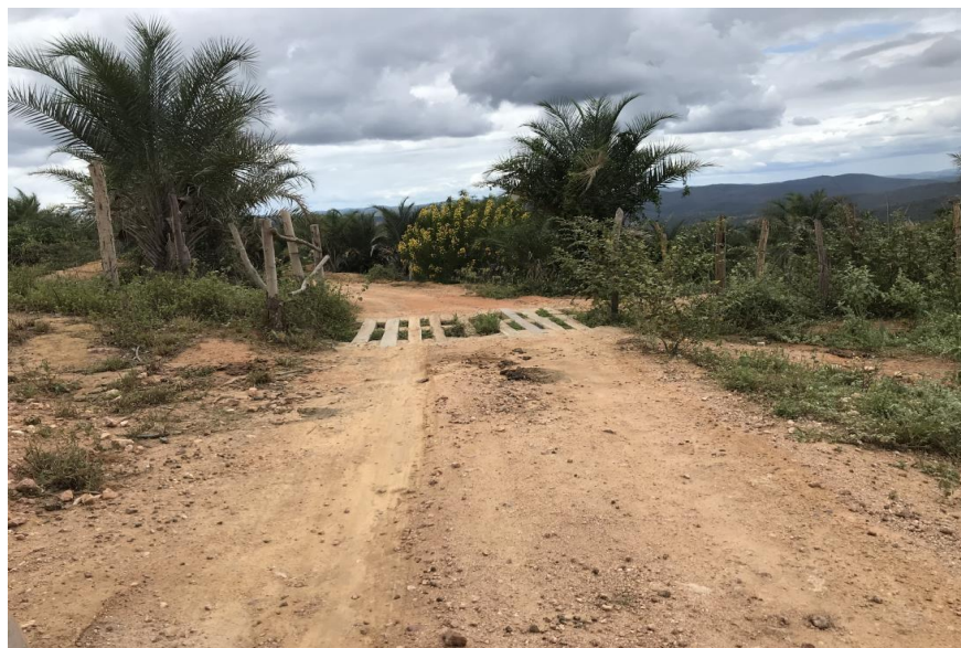
Figura 32: Trecho 02 – Mata burro a ser substituído - (Coord. 304794/ 8593086)