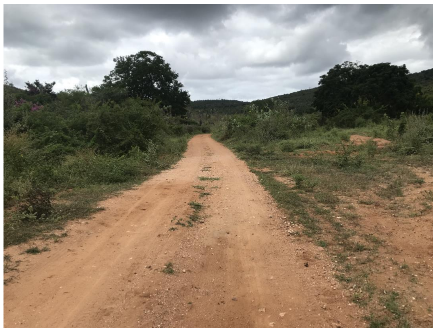
Figura 12: Trecho 01 – Ponto de implantação do BDTC 100 (Coord. 294833/ 8586346)