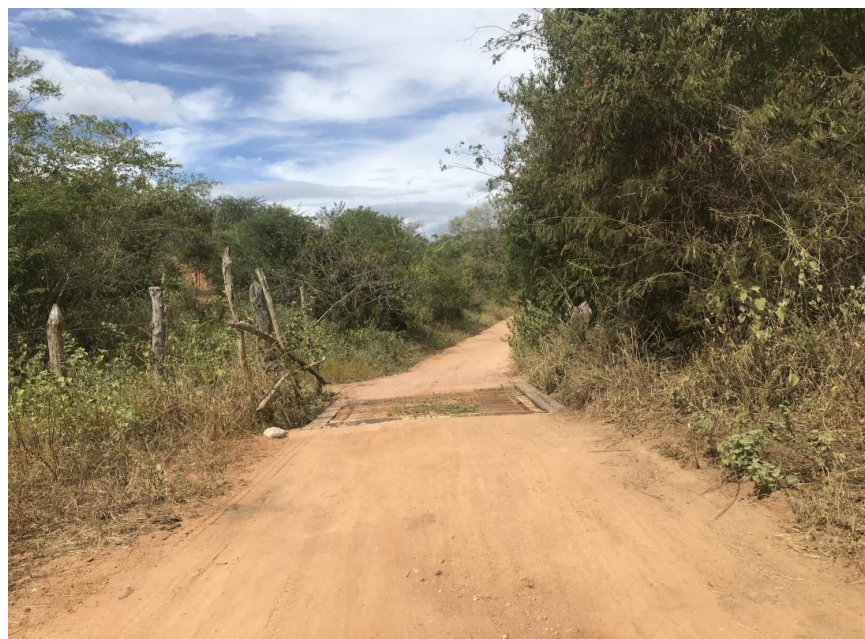
Figura 42: Trecho 02 – Mata burro a ser substituído - (Coord. 308237/ 8597534)