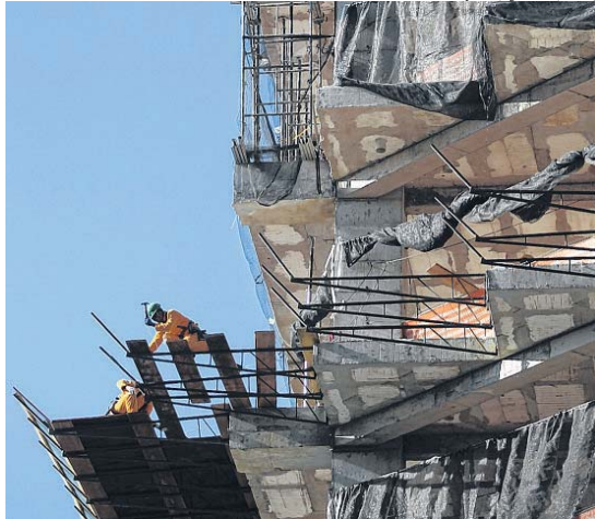
O setor da construção civil liberou os cortes de vagas formais, segundo o Caged