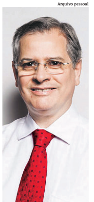
Microbiologista resalta importância de máscaras