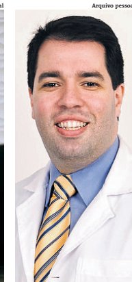
Pneumologista prevê aglomerações evitadas