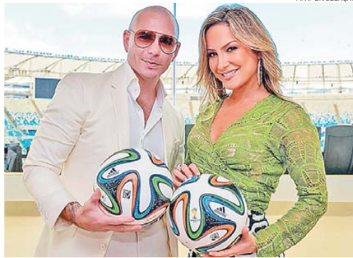
Pitbull e Claudia Leite cantam We Are One (Ole Ola), a música oficial

LANÇAMENTO Se engana quem acha que o sucesso de Lepo Lepo já foi. A música do Psirico é uma das faixas do álbum oficial da Copa de 2014. A Fifa e Sony Music Entertainment confirmaram, ontem, a lista de 14 músicas que compõem o disco, chamado One Love, One Rhythm, assim como divulgou pela primeira vez a canção oficial do Mundial, cujo nome é We Are One (Ole Ola). Escrita e coproduzida por Pitbull, astro americano com mais de 5 milhões de álbuns e 50 milhões de singles vendidos no mundo todo, a música oficial conta com participações de Jennifer Lopez e Claudia Leite. A canção já pode ser baixada pela internet. Outro baiano, Carlinhos Brown, também participa do disco, ao lado da colombiana Shakira. Juntos, eles interpretam La La La (Brazil 2014).