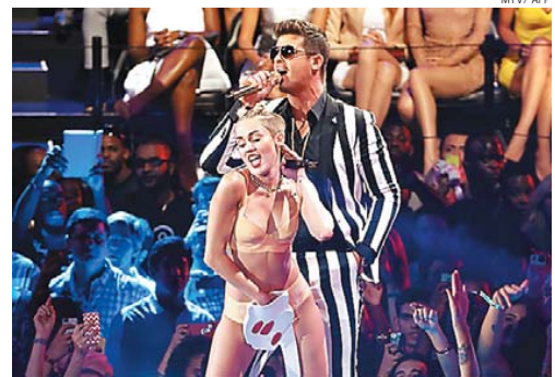
Após shows em 2011, Miley Cyrus traz para o Brasil a turnê Bangerz

impressionada com a dedicação dos fãs daqui. Recentemente, a loira, 21 anos, cancelou alguns shows da Bangerz Tour por conta de problemas de saúde, mas a turnê, que já rodou os EUA, está de volta aos palcos da Europa e tem 64 shows agendados. No repertório, os hits do novo trabalho, como Wrecking Ball, We Can't Stop e Adore You, além de covers de Lana Del Rey, Smiths, Beatles e Arctic Monkeys. A polêmica também está garantida com as performances sensuais da jovem cantora.