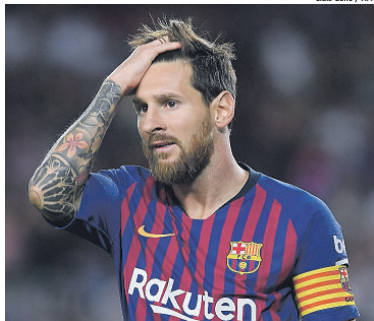
Messi foi prejudicado por desempenho na Champions e na Copa