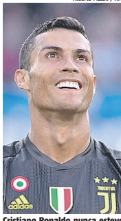
Cristiano Ronaldo nunca esteve fora do Top 3 do prêmio