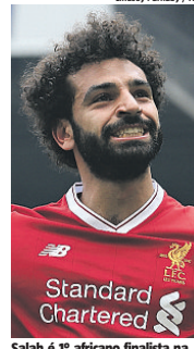
Salah é 1º africano finalista na nova fase do prêmio europeu