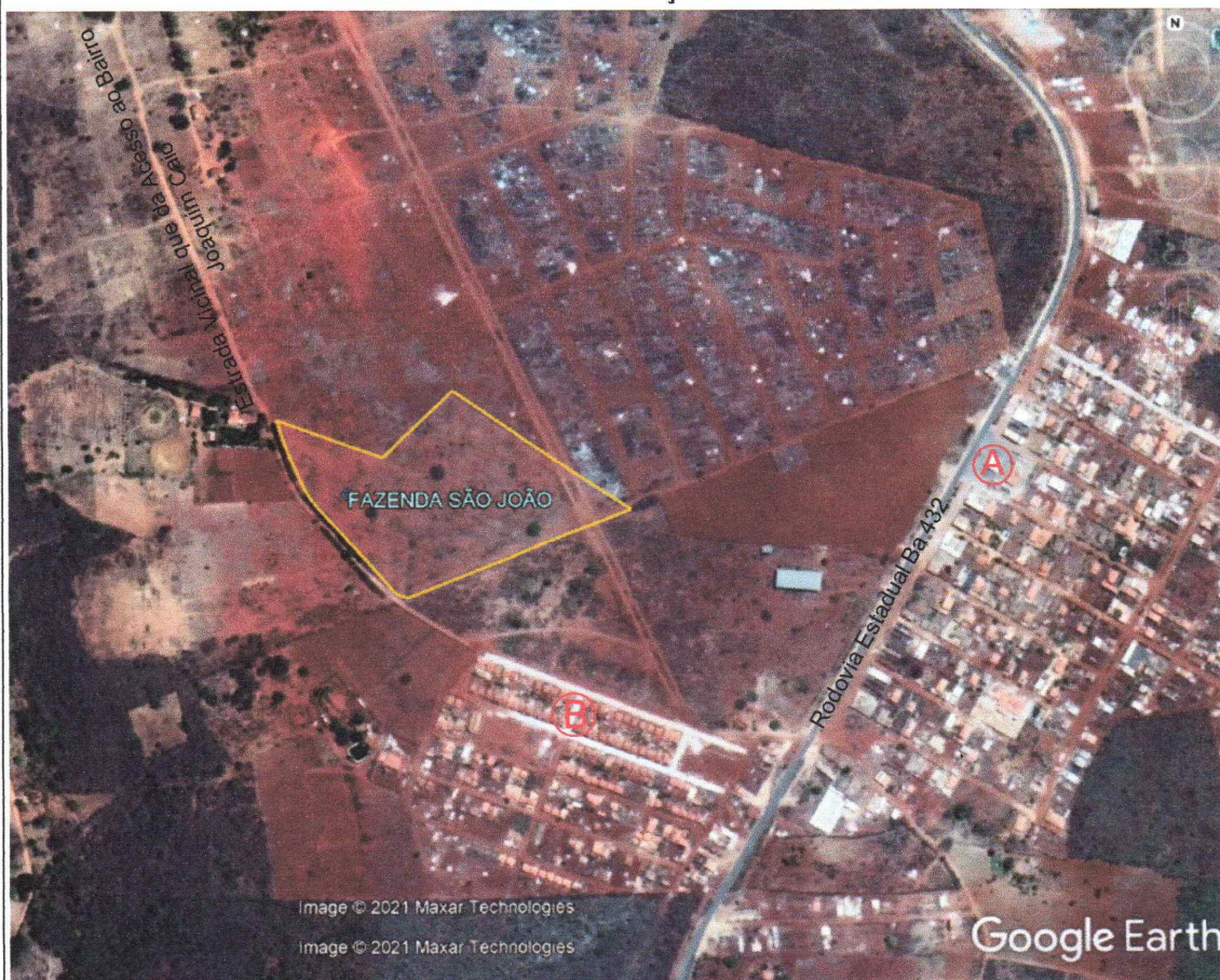
IMAGEM DE LOCALIZAÇÃO DO TERRENO