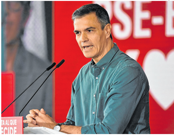
Sánchez rebate denúncia contra a esposa e diz que confia na Justiça do seu país

Pressão da oposição O Partido Popular (PP, de direita), o principal da oposição, pediu a Sánchez para "aparecer já para dar uma explicação razoável aos escândalos que cercam seu partido, seu Governo e sua