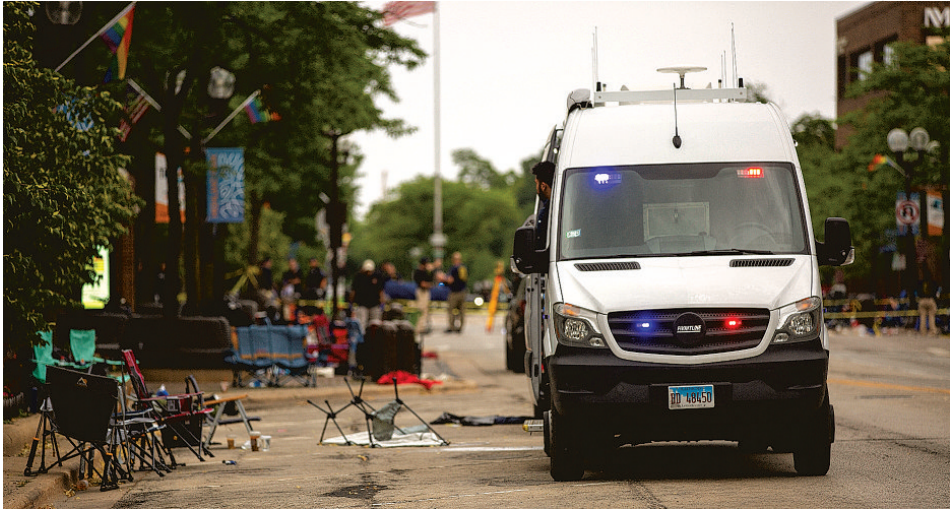
Policiais isolam área do massacre em Highland Park, ao norte de Chicago; o suspeito, identificado como Robert E Crimo III, 22, foi detido

Tanto O'Neill como Rotering informaram que o ataque a tiros começou às 10h14 do horário local (12h14 no horário de Brasília). Ao longo da rua do desfile, cadeiras