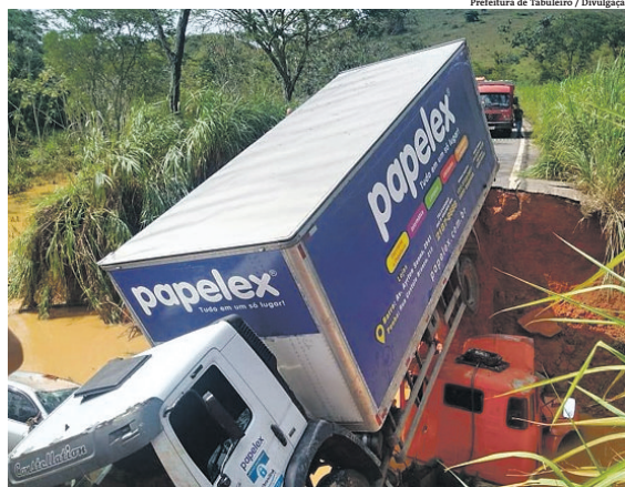
Uma pessoa está desaparecida após veículo cair em cratera em rodovia estadual

O último boletim divulgado pela Defesa Civil estadual ainda não contabilizava a morte da mulher. De acordo com o informe da manhã de ontem, o maior número de óbitos foi registrado em Belo Horizonte, onde o total de mortos já