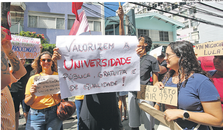
Categoria cruzou os braços por mais de 60 dias, insistindo em correção ainda neste ano, o que não foi aceito

Para os docentes, o governo propôs a reestruturação da remuneração com dois reajustes salariais – de 9%