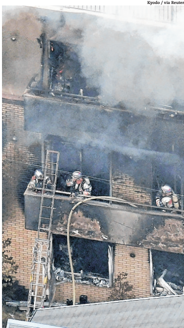
Bombeiros combatem fogo em estúdio de três andares

Dois vítimas ficaram presas no térreo e outras 31 nos dois andares ou nas escadas que levavam ao telhado, disse um porta-voz dos bombeiros à AFP. "Continuamos evacuando os indivíduos presos no prédio, alguns dos quais talvez não sejam capazes de se mover sozinhos", acrescentou a fonte. O incêndio irrompeu às 10h30 (23h30 de Brasília), em um prédio da empresa Kyoto Animation, que produz séries animadas de grande sucesso na televisão japonesa. Três horas depois, estava quase controlado,