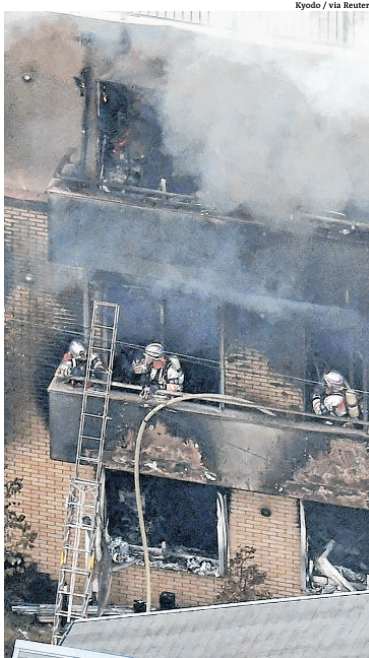
Bombeiros combatem fogo em estúdio de três andares

Dois vítimas ficaram presas no térreo e outras 31 nos dois andares ou nas escadas que levavam ao telhado, disse um porta-voz dos bombeiros à AFP. "Continuamos evacuando os indivíduos presos no prédio, alguns dos quais talvez não sejam capazes de se mover sozinhos", acrescentou a fonte. O incêndio irrompeu às 10h30 (23h30 de Brasília), em um prédio da empresa Kyoto Animation, que produz séries animadas de grande sucesso na televisão japonesa. Três horas depois, estava quase controlado,