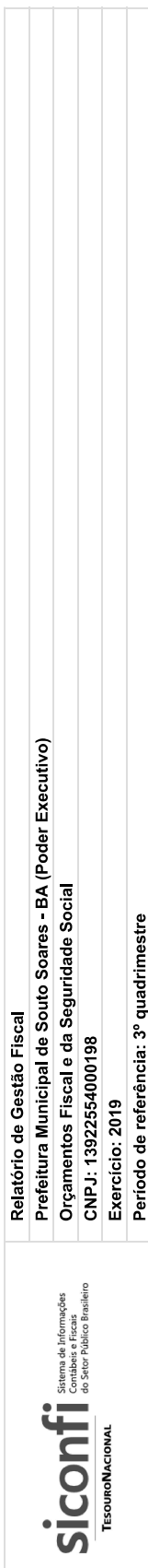
RGF-Anexo 05 | Tabela 5.0 - Demonstrativo da Disponibilidade de Caixa e dos Restos a Pagar