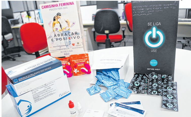
Campanha Fique Sabendo fará testes para HIV, sífilis e hepatites, distribuindo preservativos e autotestes HIV

O vai e vem nas festas e o clima de "liberou geral" também são uma boa oportunidade, na avaliação do psicólogo, para colocar em debate o perigo das ISTs, so-