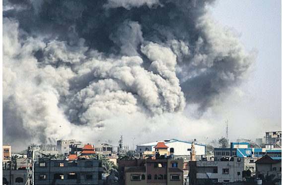
Israel lançou intensos bombardeios sobre Rafah, visando '50 alvos terroristas'

Um dirigente do alto escalão do grupo palestino, Khalil al-Hayya, disse à emissora Al Jazeera que a proposta contempla três fases, cada uma com 42 dias de duração. Inclui a retirada completa do Exército israelense da Faixa de Gaza, a volta dos