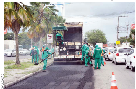
Uma das características deste tipo de serviço é a rapidez e a pontualidade

Inicialmente entrarão em operação os terminais de embarque e desembarque de passageiros localizados nas Avenidas Getúlio Vargas e João Durval Carneiro. Futuramente serão inseridos os