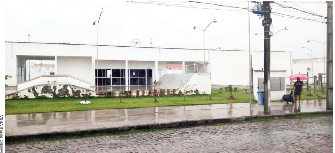
Dois dos CEUS vêm sendo comandados por dois coordenadores cada