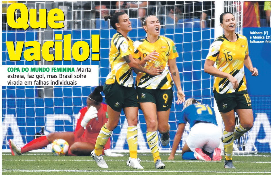
Bárbara (E) e Mônica (21) falharam feio

COPA DO MUNDO FEMININA Marta estreia, faz gol, mas Brasil sofre virada em falhas individuais