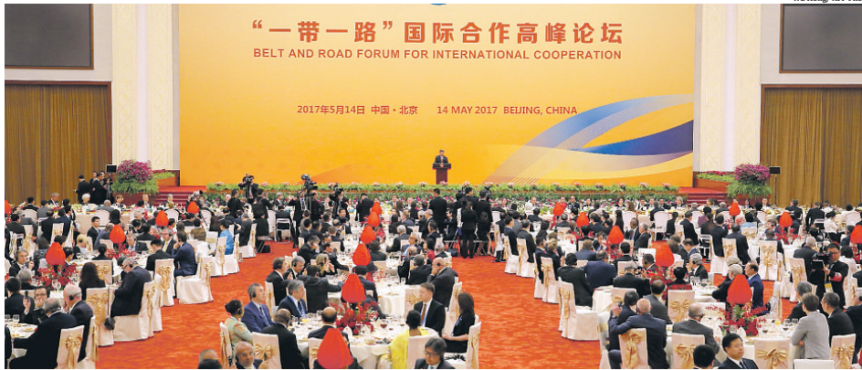
Capital chinesa recebe líderes de 29 países para discutir a abertura comercial. Anfitriões anunciaram verba para financiar infraestrutura

COMÉRCIO EXTERIOR Encontro em Pequim teve a presença dos presidentes da Rússia, Vladimir Putin, e da Turquia, Recep Tayyip Erdogan, entre outros