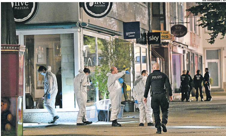
Grande operação policial foi montada em busca do homem autor do ataque em Solingen, oeste da Alemanha