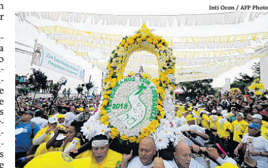
Pessoas dançam na abertura dos dois dias do festival

Devido às tensões entre a Igreja e o governo havia o medo de que a polícia não desse proteção, mas isso não impediu que os nicaraguenses fossem agradecer ao santo pelas graças alcançadas. Este ano, a festa foi marcada pela tensão que a Nicarágua vive desde 18 de abril, quando estudantes tomaram as ruas para protestar contra uma reforma no sistema previdenciário.