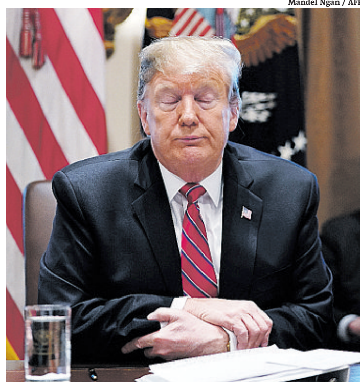
Mandel Ngan / AFP

O dinheiro previsto no acordo deverá ser investido na construção de barreiras verticais de aço, e não em um muro sólido, como deseja o presidente. Os democratas retiraram a proposta de limitar o número de imigrantes presos no território americano para uma média diária de 16,5