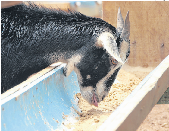
Alguns dos melhores animais de três estados estarão reunidos na Exposerrinha

e ovelhas em miniatura. No local também será montada uma feira com produtos provenientes da agricultura familiar, como hortaliças, frutas e verduras. No ano passado, a feira contou com dois mil visitantes e a previsão é que este número dobre agora em 2019. "A Exposerrinha tem tudo