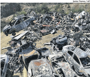
Fogo deixou um rastro de casas e carros queimados