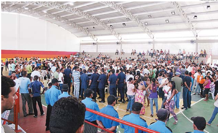
Policial era muito popular e querido na região; velório de soldado lotou ginásio em Mata de São João

O enterro foi acompanhado por policiais de diversos batalhões e unidades da Polícia Militar e por policiais civis também. Membros da Caatinga, Cipe, Batalhão de Choque e colegas da Polícia Rodoviária Estadual cantaram o Hino da PM-BA poucos antes do corpo ser enterrado.