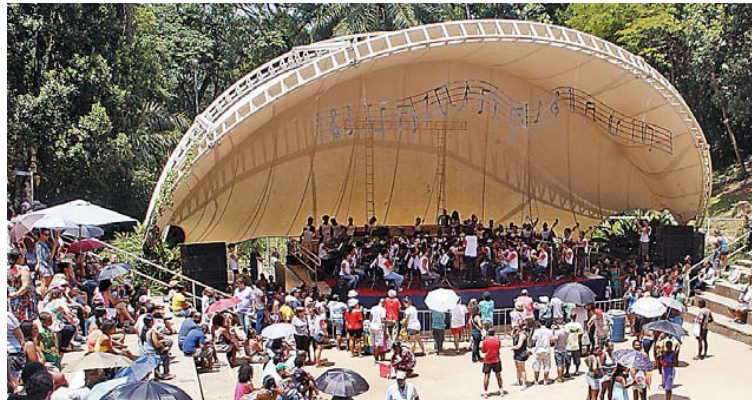
Público assiste à apresentação, que terminou com uma versão samba de Noite Feliz e um frevo