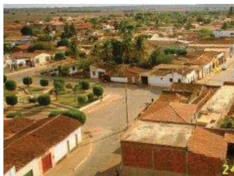
Vista parcial da cidade de São Gabriel

Largo da Pátria, 132 – Centro – São Gabriel Bahia CEP.: 44.915-000 FONE/FAX: (74) 3620-2122