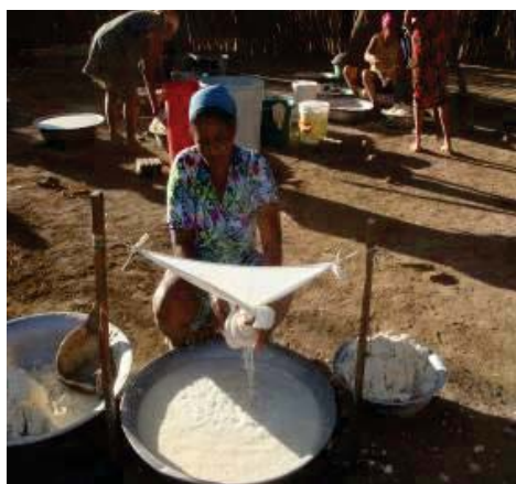
Mulher coando tapioca