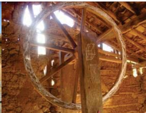
Foto do interior da casa de farinha