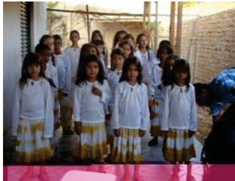
O coral dos Querubins de São Gabriel