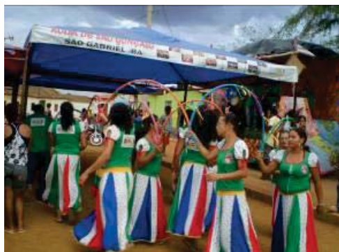
A roda de São Gonçalo

ESTADO DA BAHIA Prefeitura Municipal de São Gabriel CNPJ (MF) 13.891.544/0001-32