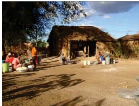
Foto da casa de farinha

ESTADO DA BAHIA Prefeitura Municipal de São Gabriel CNPJ (MF) 13.891.544/0001-32