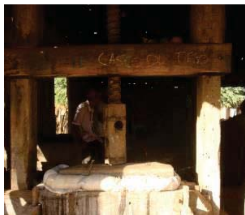
Prensa da casa de farinha