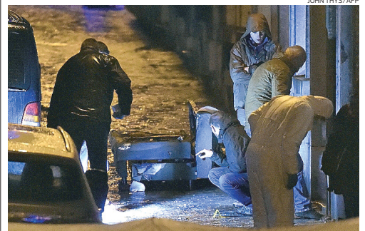
A operação frustrou um ataque terrorista contra prédios da polícia

vido disparos em um prédio de uma rua residencial perto da estação de trem da ex-cidade industrial, que fica entre Liège e a fronteira alemã e a 125 km de Bruxelas. Verviers tem uma ampla população imigrante. De acordo com uma autoridade de contraterrorismo belga citada pela rede de TV americana CNN, o grupo alvo da operação teria sido instruído pelo Estado Islâmico a lançar ataques na Bélgica e na Europa em represália aos ataques aéreos liderados pelos EUA contra a facção radical na Síria e no Iraque. A ofensiva na Bélgica ocorre em meio a uma caçada internacional por possíveis cúmplices dos três terroristas que deixaram 17 mortos na França na semana passada.