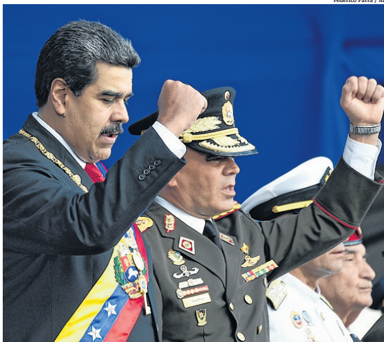
Maduro e ministro da Defesa, Vladimir Padrino, fazem mesmo gesto na posse

presente da União Europeia (UE) ou a maioria dos países das Américas. Coincidindo com a posse, duas horas depois, a Organização dos Estados Americanos (OEA) aprovou uma resolução para declarar ilegítimo o segundo mandato de Maduro. A resolução, aprovada por 19 votos a favor, seis contra, oito abstenções e