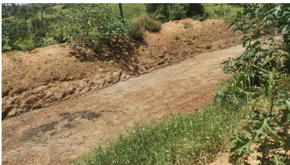
Foto 05: Bacia de contenção esvaziada, somente com lodo em secagem.