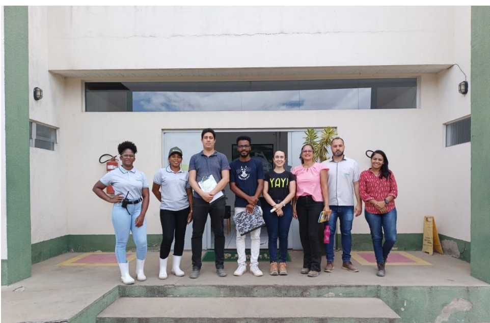
Foto 07: Equipe responsável pela inspeção (SEDAEMA, Consórcio Portal do Sertão e empresa).