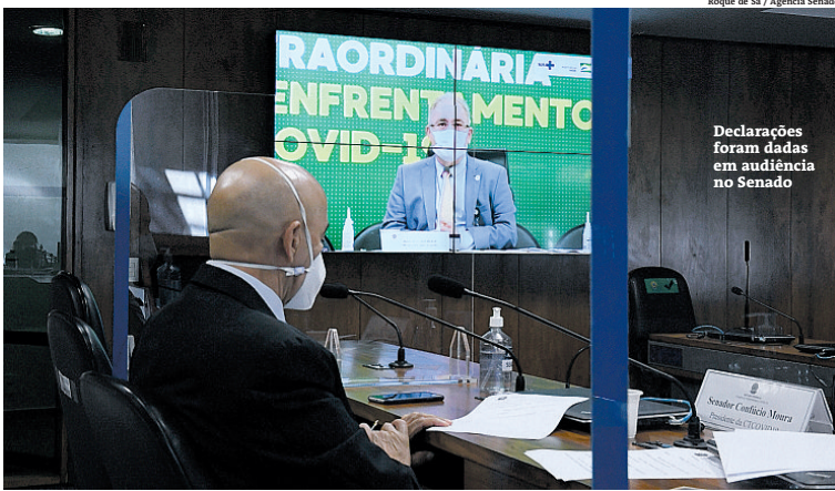
Roque de Sá / Agência Senado

O ministro destacou a compra de mais de 600 milhões de doses em diferentes iniciativas, como aco-