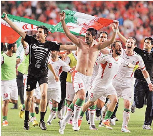
Jogadores do Irã comemoram a classificação para a Copa de 2014