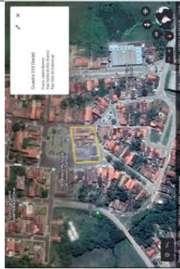
Foto de Localização do Lote nº 019