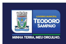
VERSÃO 3D COLORIDA