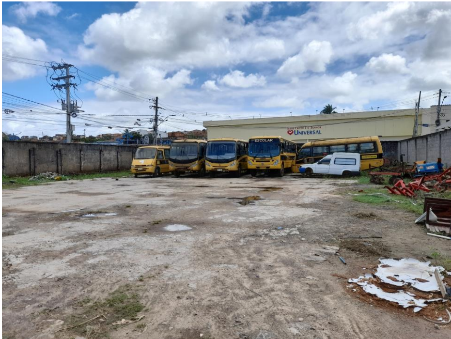
Foto 7 – Vista geral da área onde será construído o estacionamento.