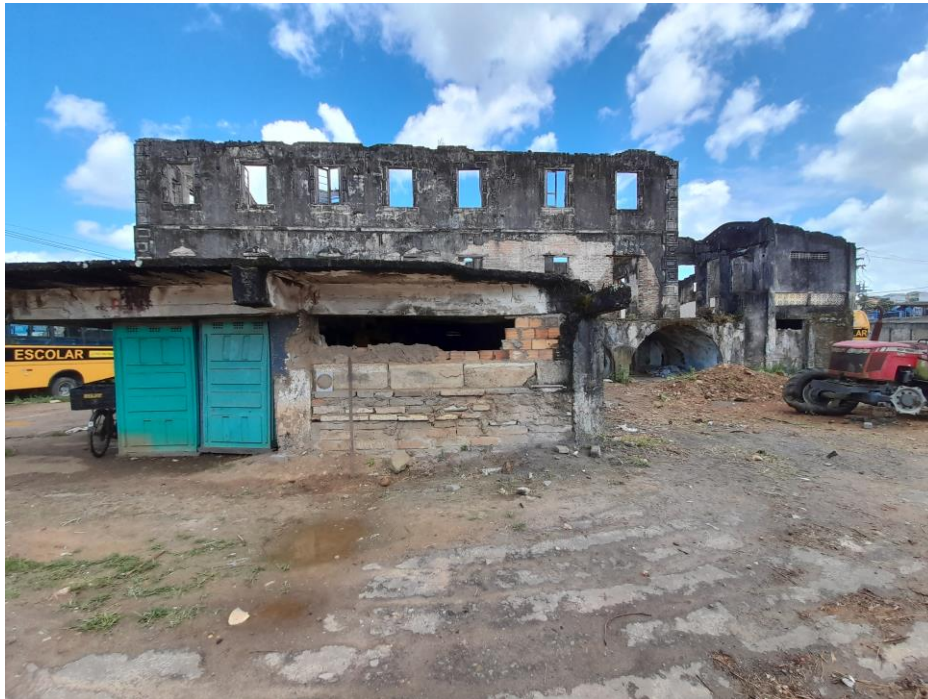
Foto 2 – Vista das ruínas do Irapuru e laje a ser demolida (no centro e em primeiro plano).