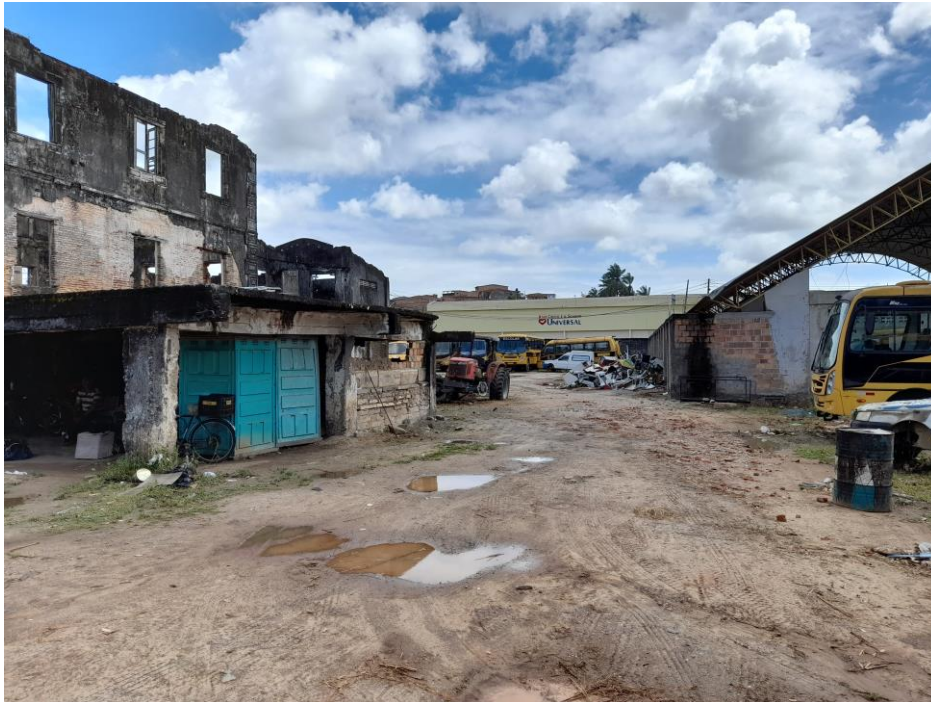
Foto 6 – Vista geral da área. Ruínas do Irapuru à esquerda. Quadra Poliesportiva à direita e acima.