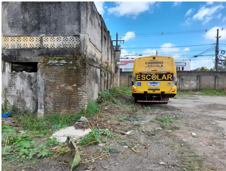
Foto 8 – Área onde será construído o estacionamento – à esquerda edificação existente.