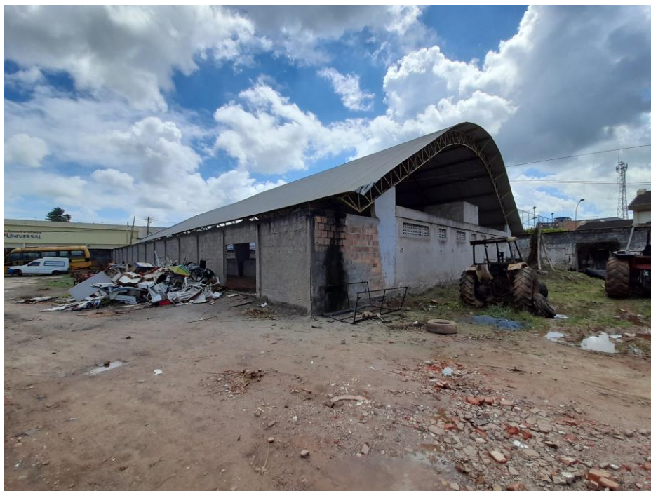
Foto 4 – Vista da Quadra Poliesportiva existente (obra a ser concluída independente da obra do Restaurante Popular).