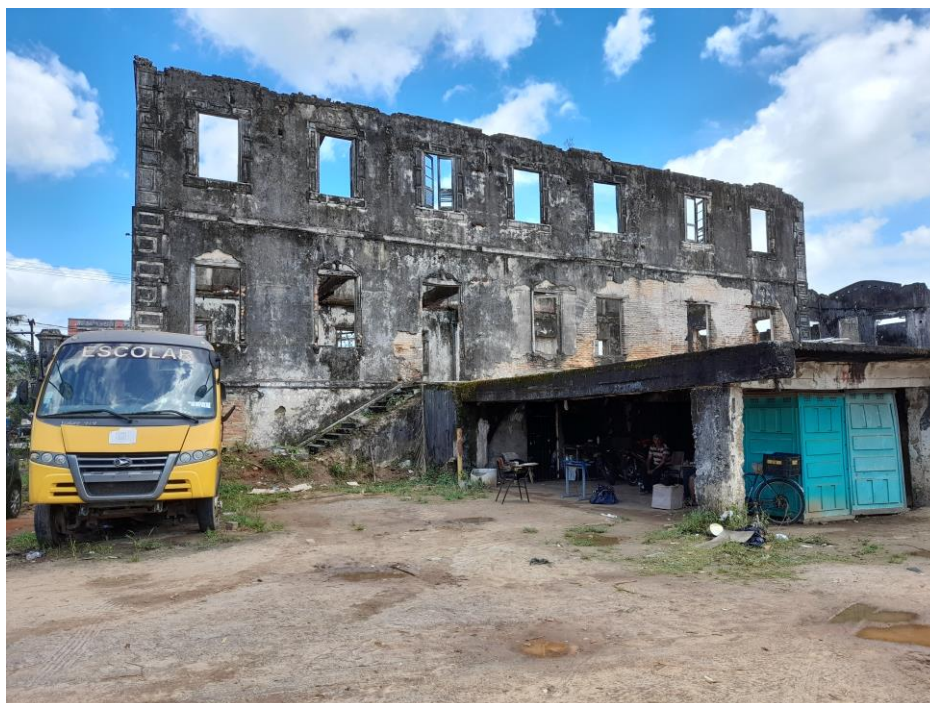
Foto 9 – Ruínas do Irapuru. No centro e à direita, área de laje a ser demolida.