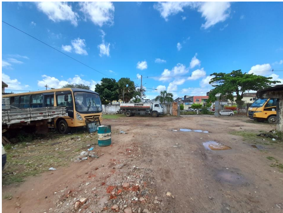
Foto 10 – Vista geral da área. Ao fundo, portão de acesso via Av. Presidente Vargas.