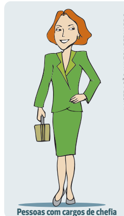
Pessoas com cargos de chefia