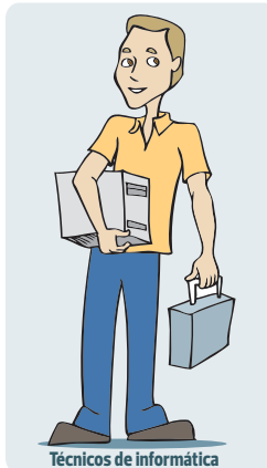
Técnicos de informática