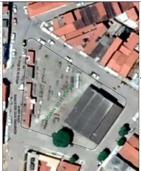
MAPA DE COORDENADAS