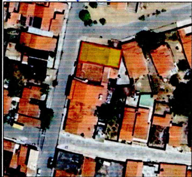
TABELA DE COORDENADAS