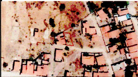
TABELA DE COORDENADAS