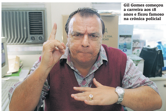
Gil Gomes começou a carreira aos 18 anos e ficou famoso na crônica policial