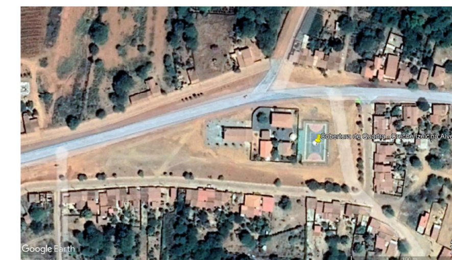
PLANTA GEORREFERENCIADA SEM ESCALA