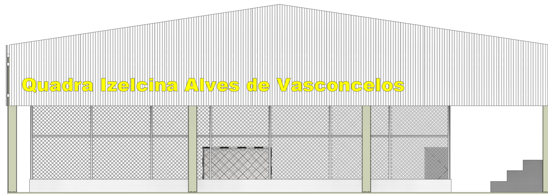
2 FACHADA FRONTAL ESCALA - 1 : 100