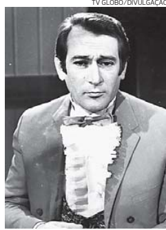
Na Globo: A Cabana do Pai Tomás